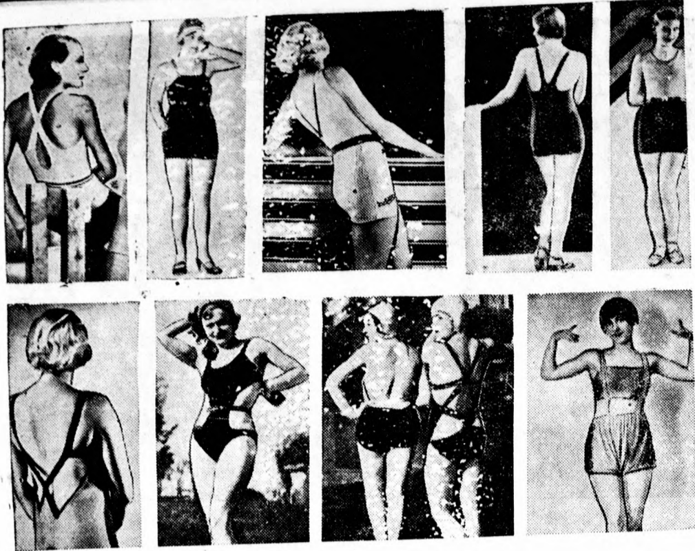
Berlinben most rendezték meg a jövő év strandivat-bemutatóját.

»Kismet« — »Csókfergeteg.« A végzet, a sors a keleti ember életében a legnagyobb hatalom. Ez szövi, fonja élete fonálát és sokszor kegyetlen játékot űz az emberrel. A »Kismet« ebben a csodálatos keleti világban mozog. Arról beszél, hogy a pénz sokszor csak csalódást, szenvedést hoz és a sors útját kikerülni lehetetlen. Világszínpadokon világhírességek játszották már a »Kismet« szerepeit s most, hogy filmre került, fénybe és ragyogásba öltözött. A szereplők itt is a legnagyobb sztárok, mint Dita Parlo, Gusztáv Fröhlich, Wladimir Sokoloff. Emellett a nagy darab mellett fut a »Csókfergeteg« című operett, melyben a szépség, a dal és muzsika uralkodnak. Elegáns milliő, Páris és Milano, sarkantyupengéses táncok — ez a »Csókfergeteg«, ínt az örök hatalom, a szerelem támaszt s tesz elragadó erejűvé. Jegyekről elővételben ajánlatos gondoskodni.