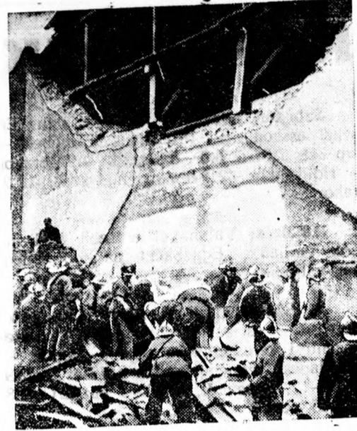
A varsói házbeomlás, melynél — mint jelentettük — 18 ember meghalt, 20 súlyosan megsebesült. A szerencsétlenséget az okozta, hogy egy gyár tűzfala rázuhant a szomszédos munkásbérház tetőzetére.