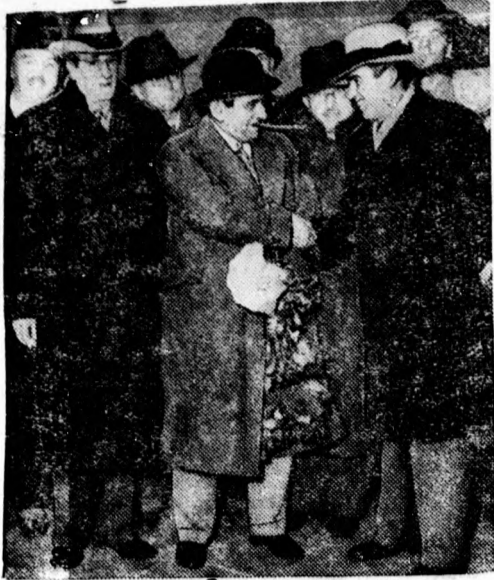
Lubitsch Ernő, a világhírű amerikai filmrendező 5 és fél éves távollét után hazatért Berlinbe, ahol első sikereit aratta.