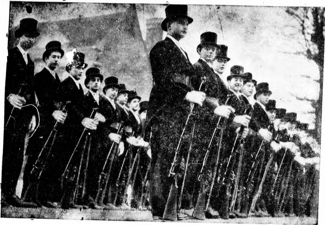
Cilinderes hadsereg. Az etoni egyetemi hallgatók katonai szemléje.