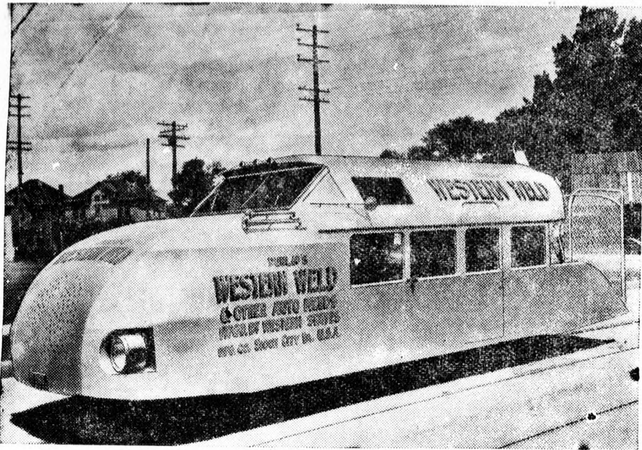
Egy amerikai mérnök Zeppelin alakú autóval kísérletezik. Az autót repülőgépmotor hajtja, melyet propeller hoz működésbe.

A MÁV fejleszténi fogja a motoros-vonat-forgalmat. A vasúti forgalom csökkenése miatt az Államvasutak igazgatósága újításokra törekszik. Így vetették fel azt a gondolatot, hogy a jól bevált motoroskocsi-forgalmat fejlesszék. Így a budapest—bécsi vonalon gyorsjáratu motoroskocsikat állítanak be, amelyek 100 kilométeren felüli sebességet tudnak majd kifejteni. Ezenfelül számos olyan vonalon, ahol most nagyobb szerelvényből álló vonatokat járatnak, de a forgalom nem követeli azok fenntartását, egy-két pótkocsival ellátott motoroskocsikat fognak a jövőben járatni. Az új motoroskocsikat a most üzemben lévő benzín helyett nyersolajjal fogják tütenni.