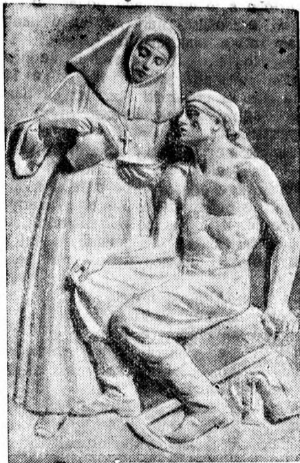
A beutheni bányaszerencsétlenség alkalmá- val megmenekült bányászok hálaadásul emlékművet állítottak