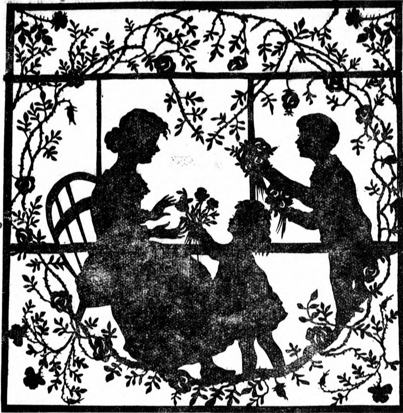
A tavasz első virága az anyáé

A menyasszony: Hányszor esküdtél, hogy pénz nélkül is elvennél!