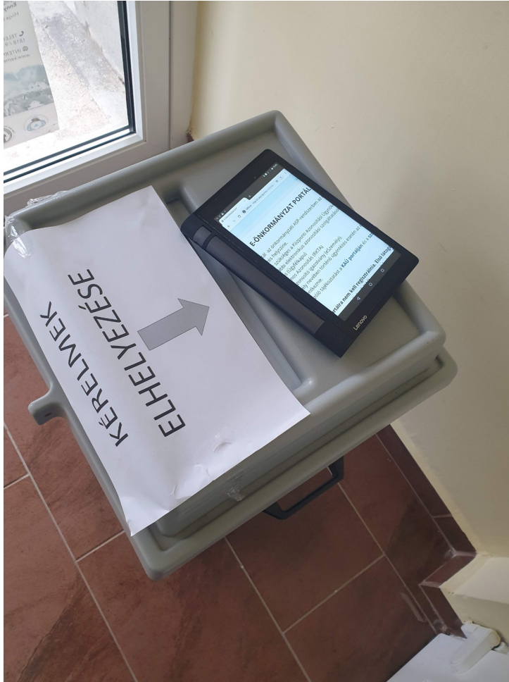
Molnár Péter: Pandémia idején – 2020-as életkép egy önkormányzati hivatalban