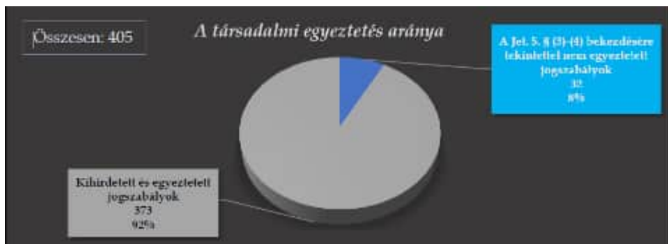
1. ábra

Az egyes tárcák tevékenységét vizsgálva a KEHI hiányosságokat tárt fel, melyek a jogalkotással kapcsolatos új rendelkezések végrehajtása során keletkeztek. Az alábbi ábra szemlélteti, hogyan alakult az egyes minisztériumok és miniszterek által elkészített jogszabálytervezetek száma és a mulasztások száma a vizsgált időszakban. Trendvonal köti össze a mulasztások előkészített tervezetekhez számított arányát.