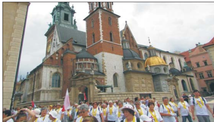
Örök emlék marad ez az út.

ha jól szeretné berendezni... mxm lakberendezés: 30/ 916 30 16 www.mxm.hu tervezés + bútorgyártás + kiegészítők