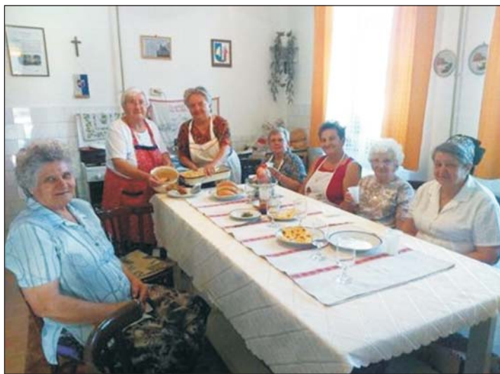
A nyugdíjasklub tagjai hagyományos ételekkel.

A szombati nyílt délután nem titkolt célja volt, hogy minél több fiatal, gyermek tapasztalatot, ismereteket szerezzen a régi életmódról, tudják értékelni a múltat, amely a gyökereink, ebből ágazik a 21. század is. Mottónkul a következő idézetet választottuk a szü-