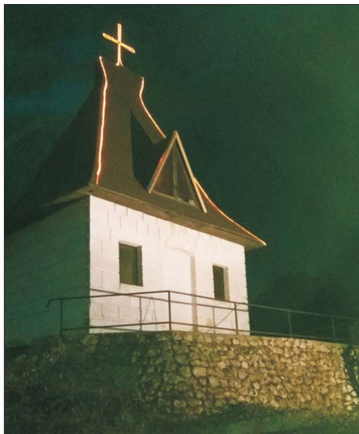
Éjszaka az egerváriak álmát vigyázza.