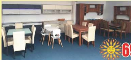
ÚJ KONYHASTÚDIÓ BLOKK KONYHÁK