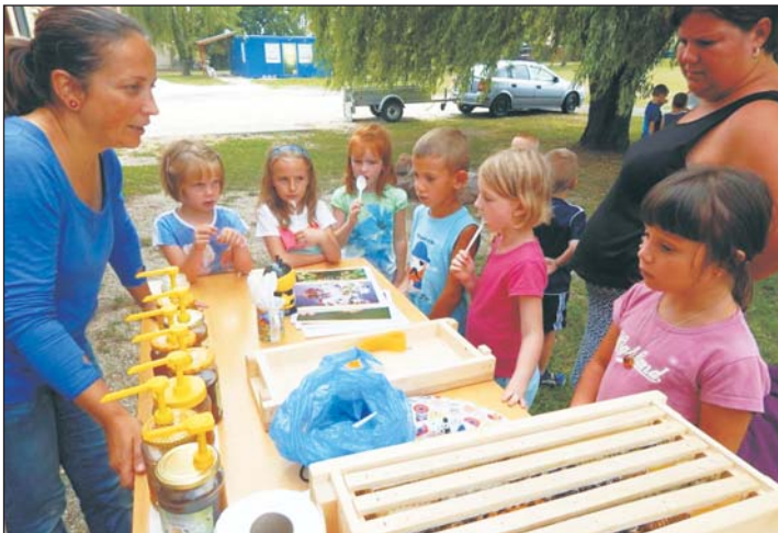
A méhek életébe is betekintettek a gyerekek.