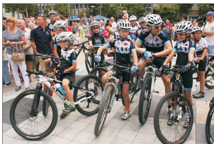
Érdeklődők és résztvevők egyaránt nagy számban jelentek meg a Restart Fesztiválon.