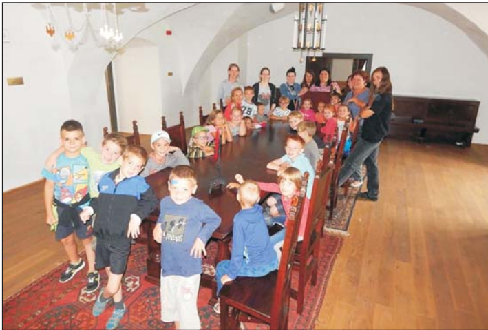
A várban is szívesen fotózkodtak.