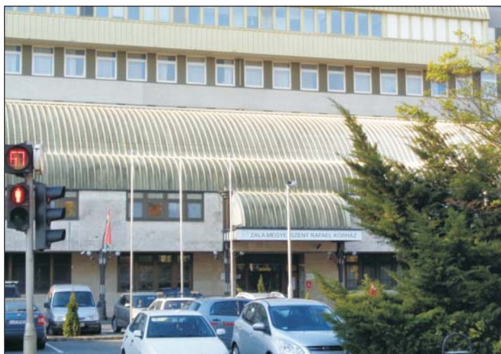
A korábbi 4,9 milliárd mellett további 2,3 milliárd forintot kap fejlesztésre a Zala Megyei Szent Rafael Kórház.

2017-ben a KEHOP-5.2.11-16-2016-00017 „Fotovoltaikus rendszerek kialakítása a Zala Megyei Szent Rafael Kórházban” című projektnek köszönhetően a kórház központi épületegyüttesén napelemes kiserőmű kiépítése valósul meg.