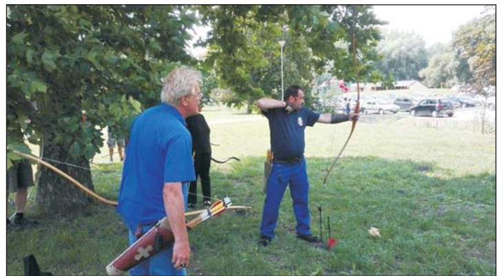
Az íjászversenyre több mint nyolcvan ember érkezett.

A várkastély továbbra is minden korosztálynak kínál programokat. Jó példa erre a szeptember kilencedikei Halász Judit koncert, mely a környéken másutt nem lesz, így nagy az érdeklődés. Augusztus 19-án az utóbbi időben egyre népszerűbb Punnany Massif