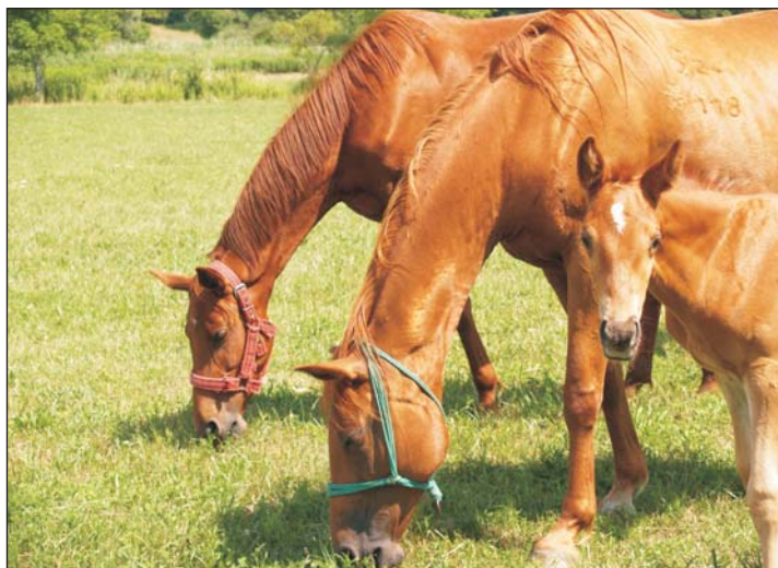
Higgadt, fegyelmezett lovak.