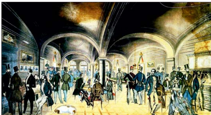
A Pilvax-kávéházban izgatottan tárgyalták a híreket.

Kutyának se kellő, pocsek reggelre ébredt azon a napon a város. A dermesztő szél ólomszürke felhőket hajszolt az égen, időnként eleredt a havaseső. A Pilvax-kávéházban viszont jó meleg volt, ahol már jókor reggel ügyvéd-bojtárok, firkászok, a radikális értelmiségi ifjak ültek körül a nagy márványasztal és tárgyalták izgatottan a Párizsból , Bécsből és Pozsonyból érkező híreket.