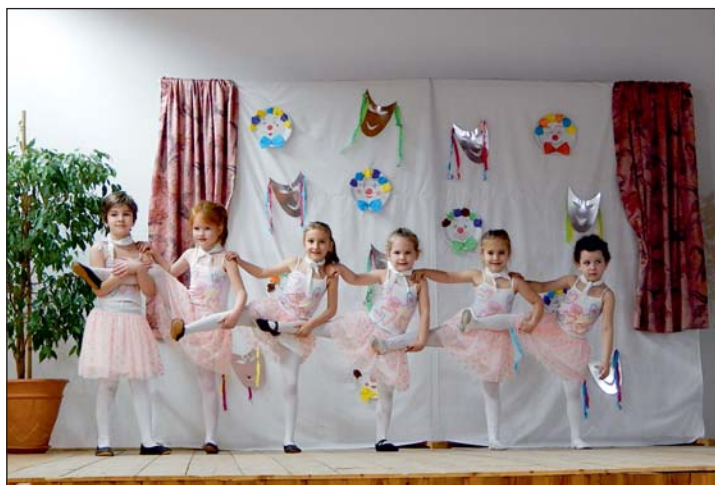
Bemutakoztak a táncoslányok.

lált. A tombolatárgyak felajánló: a Mozgássérültek és Fogyatékkal Élők Egyesületének