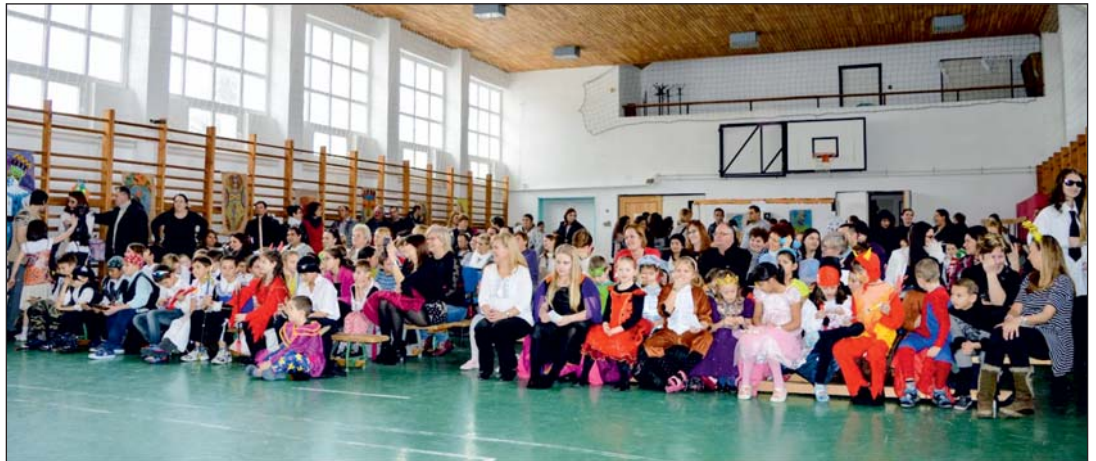
Nagyszabású rendezvény volt.

Nagyszabású farsangi mulatságot szerveztek a Csertán Sándor Általános Iskolában február 8-án. A Télbúcsúztató maskurázás a EFOP 1.3.9. pályázat keretében, mint hagyományörző rendezvény valósult meg. Az egész napos programsorozat keretében mintegy száz nemesapáti és alsónemesapáti diák ismerkedhetett meg a farsang történetével és a nevezetes farsangi karneválokkal. A felsős tanulók power point segítségével bemutatták a mohácsi busójárás, a velencei és a riói karnevál fontosabb eseményeit, s a