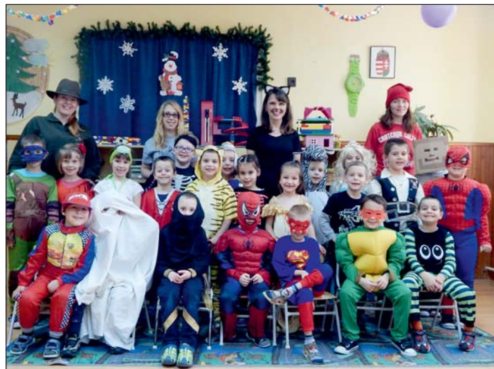
Az ovis farsangolók.

Farsangi karneválunkat az Egervári Óvodában 2018. február 6-án a középső, február 7-én a nagy és február 8-án délelőtt a kiscsoportban tartottuk.