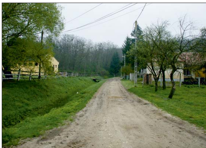
Szilárd burkolatot kap a Petőfi utca.