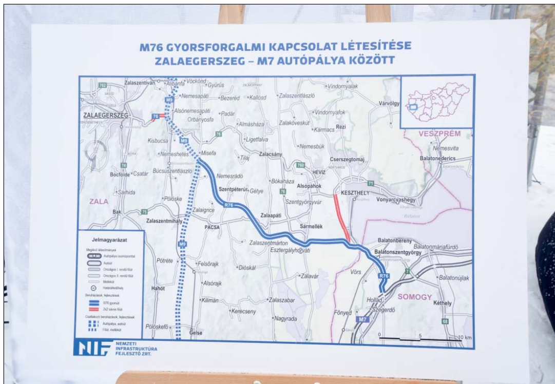
Az M76 útvonala.

Zalaegerszegen vagy a városhoz kötődően 212,5 milliárd forint fejlesztés valósul meg, az M76-os beruházásán kívül pedig elkezdődik a Zalaegerszeg és Vasvár közötti gyorsforgalmi út tervezése is. A zalai megyeszékhely beruházásainak összegéből 201 milliárd hazai forrás – beleértve az M76-os teljes költségét –, 11,5 milliárd pedig uniós forrás.