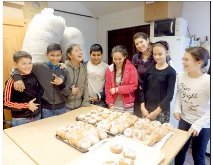
Igazi szalagos fánk várt a diákokra.

Jó volt látni a kipirult, elégedett arcokat, a gyerekeket, akik egy napra kiszakadtak a mindennapokból, megteremtve egy sajátos mesevilágot!