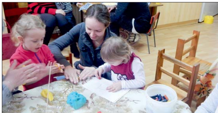
Kellemes délutánt töltöttek együtt.

2018. február 27-én kedden játékos délutánt szerveztünk a leendő óvodásoknak és szüleiknek, ahol megismerkedhettek az óvodapedagógusokkal és a dadus nénikkel. Az óvoda-