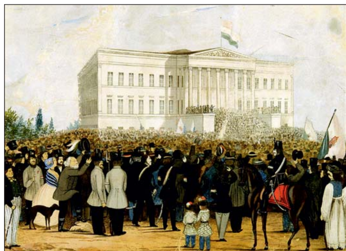
Petőfi Sándor a Nemzeti Múzeum lépcsőjén elszavalta a Nemzeti dalt.