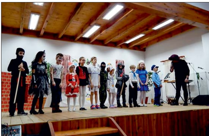
Az iskolás korosztály jelmezesversenye.