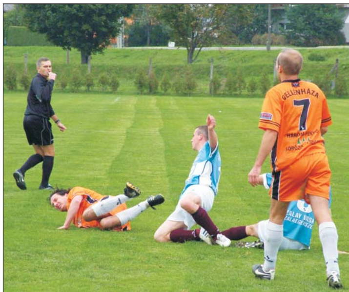
Jelenet az októberi Teskánd-Gellénháza mérkőzésről.

A megyei I. osztályú labdarúgó-bajnokságban a 7. helyen várja a folytatást a Gellénháza-Farkas Pálinka csapata. 14 mérkőzésen 6 győzelmet aratott, öt döntetlent játszott és 3 vereséget szenvedett, a gólkülönbsége 30-20, mindez 23 pontot jelent.