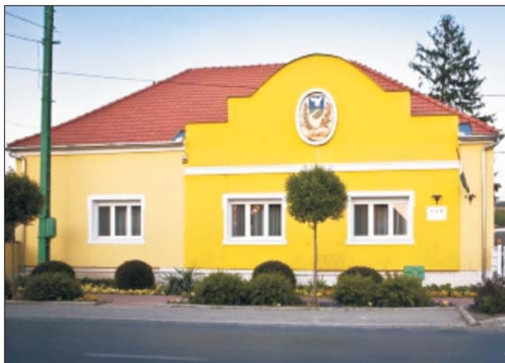
Kétes zalai dicsőség: az eladósodott települések országos listáján Gelse az elsők között szerepel. Súlyos a korábbi SZDSZ-es faluvezetés „hagyatéka”.

- Figyelni kell arra, hogy ne termelődjön újra a tartozás, s ezért az önkormányzatoknak is tenniük kell. A többszintű közigazgatási rendszer, a járássok újraélesztése is segít majd a felelős gazdálkodásban, megakadályozva az önkormányzatokat a felelőtlen hitelfelvételben, ügyelve arra, hogy a hatóság kiadása ne legyen több, mint a bevétele.