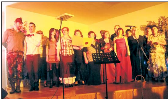
Az akadályt átugrotta a Szivárvány Dalkör.

November 18-án, vasárnap 17.00 órakor a tófeji Szivárvány Dalkör „Musical - Nótá-Operett” címmel adott műsoros estet a helyi közösségi ház rendezvénytermében.