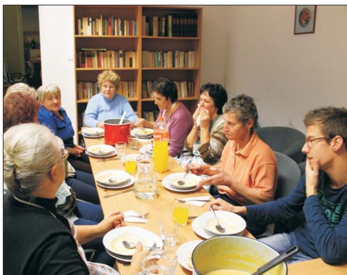
Amit főztek, meg is ették.

(Folytatás az 1. oldalról) igényekhez igazítva hetente hétfőn 10 órakor tartanak. 28-án adventi koszorúkötés volt a házban, 29-én a „Zöldklub” foglalkozására, 30-án