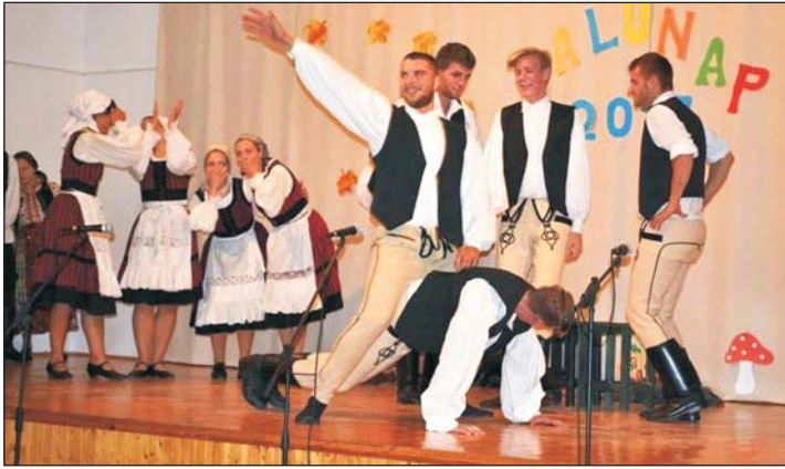
A Zalai Táncegyüttes fiatal táncosai.

Nagylengyelben 17 éve, 2000. szeptemberében adták át az új faluház épületét, ezért azóta is minden évben ezekben a hetekben kerül sor a falunapra. Idén a hónap második szombatján – szerencsésen időzítve – napsütéses időben zajlott a rendezvény. Bár az időjárás a szabadtéri munkáknak és a szüretnek is kedvezett, ennek ellenére szép számmal voltak érdeklődők. Az egész napos program főzőversennyel indult, amelyen a helyi csapatok (nyugdíjasklub, óvoda, polgárórság) mellett, a zalatárnoki Gastro Klub is képviseltette magát. Verse-