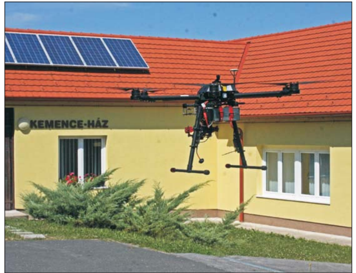
A Kemence-ház számos programnak ad otthont.

A ház az idei őszön is különféle programokkal várja a