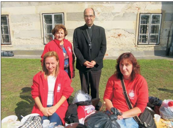
Szent Erzsébet ünnepén Körmendre látogattak.

Plébániánkon 2 éve alakult meg a Karitászi csoport , melyben mind a 6 település önkéntesekkel képviselteti magát. Szeptember 23-án a szombat-helyi Egyházmegyei Karitászi közösségi napján, Szent Erzsébet ünnepén jártunk Körmenden.