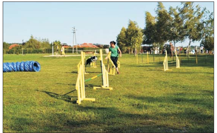
Bemutatót tartott a Göcsej Kutyaklub.