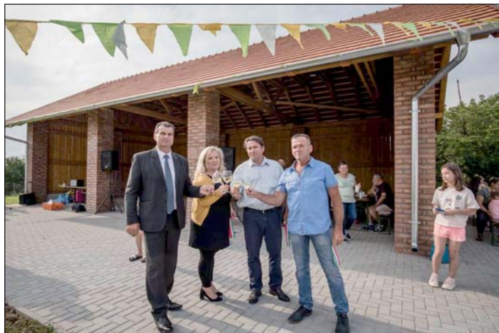
Koccintás az új létesítmény átadásán.

lett aktív közösségi élet legyen a falvakban, hogy ne csak alvó települések legyenek. Petrikeresztúron látható, hogy aktív közösségi élet folyik, az átadó