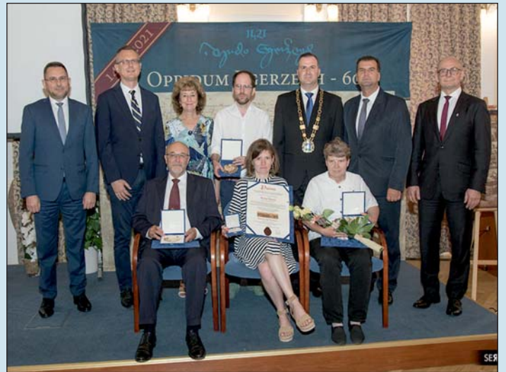
Az ünnepi közgyűlésen kitüntetéseket adtak át.

Az ünnepi közgyűlésen posztumusz díszpolgári címben részesült néhai Fischer György Munkácsy-díjas szobrászművész, a kitüntetést gyer-