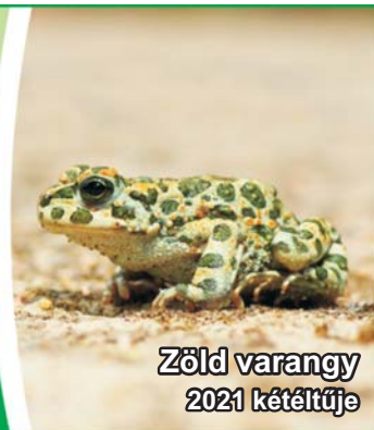
Zöld varangy 2021 kétéltűje