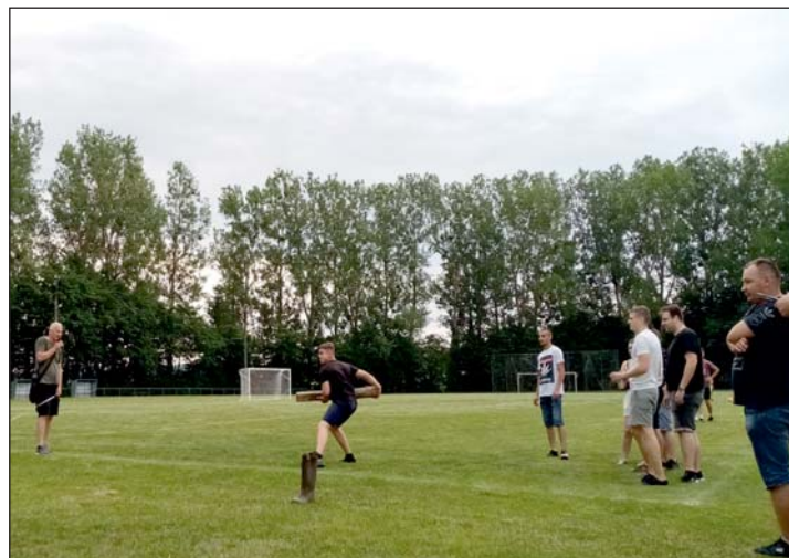
A rönkhajtás komoly erőpróba volt.