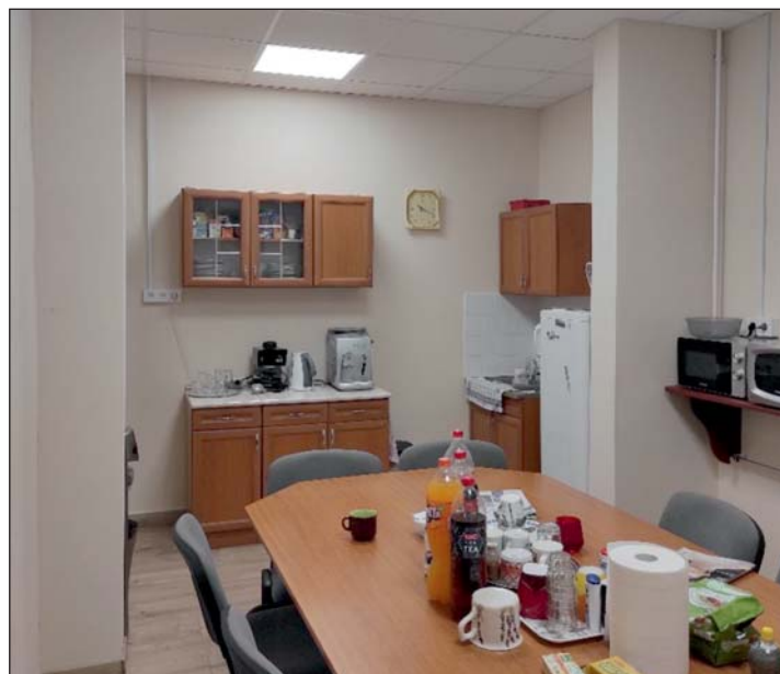
A kor színvonalának megfelelően...