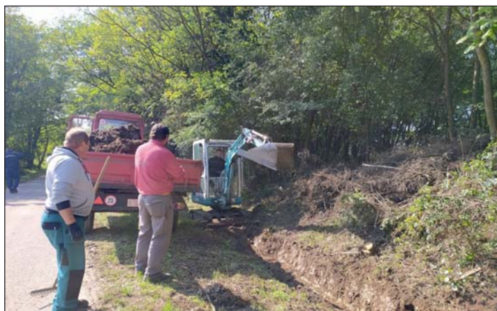
Újraminősítő gyakorlatot tartottak.

2012 óta szerveződnek az ország egész területén a Települési Önkéntes Mentőcsapatok az esetleges helyi katasztrófák gyors, helybeli erővel történő kezelése, valamint megelőzése érdekében. A katasztrófavédelem kockázatbecslés alapján I-III. kategóriákba sorolta a településeket, legveszélyesebb hatásokat I. számmal jelölve. Amely település I-es vagy II-es kategóriába tartozik, ott fokozott figyelemre, a szokásosnál is nagyobb, megelőző felkészültségre van szükség, amelyben elengedhetetlen szerepe van a helyi önkénteseknek.