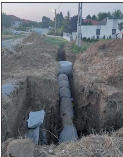
Közel 33 millió forint a támogatás.