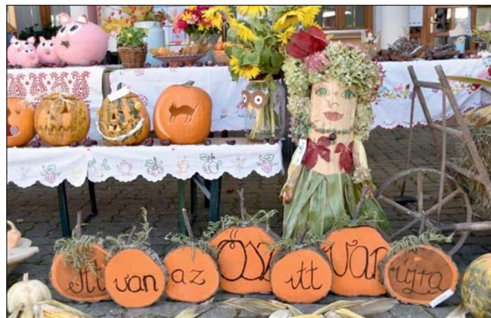
Itt van az ősz – ötletesen hirdetve.