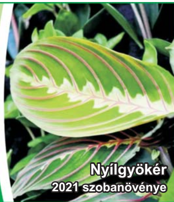
Nyílgyökér 2021 szobanövénye