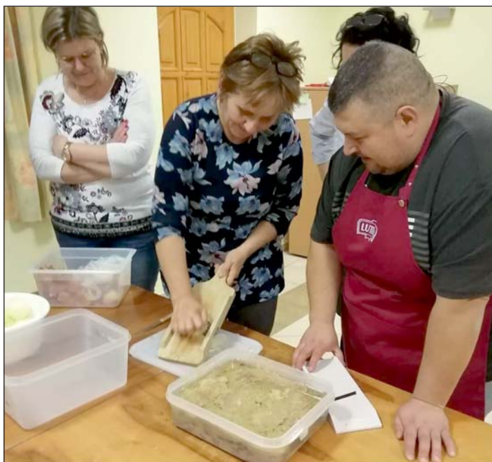
Főzőtanfolyam indult a faluban.