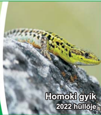
Homoki gyík 2022 hullője