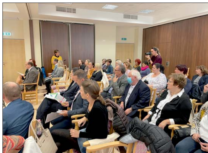
Nagy érdeklődés övezte az eseményt.

Emellett a projekt egyik legfontosabb tevékenységként a partnerek energetikai auditokat és általános épületgépészeti méréseket hajtottak végre 10 kiválasztott háztartásban (5 magyar és 5 horvát). Összesen három mérésre került sor: termografikus mérés (hővesztesség mérés hőkamerával), Blower-door teszt (légtömörség mérés) és végül az U-érték mérés (hőszigetelő képesség mérés). Az U-érték mérő eszközt valamennyi háztartás esetében 7 napig a családi házban hagyták, és a szakemberek egy héten keresztül figyelték az általa kibocsátott értékeket, jeleket. A mérések eredményeképpen az ingatlantulajdonosok konkrét iránymutatásokat kaptak az energiahatékonyság növelésével kapcsolatban. Ezenkívül még a projekt zárása előtt egy egyedülálló online energiagazdálkodási eszköz is kifejlesztésre kerül, amely a lakosság számára elérhető lesz. Ennek segítségével láthatják, hogy milyen intézkedéseket alkalmazhatnak az otthonukban azért, hogy csökkenjen az energiaszegénység kockázata.