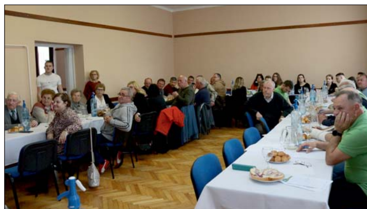
A borverseny résztvevői az értékelést hallgatják.

minél színesebb programokkal tudják tagjaik életét gazdagítani, valamint a falu lakosságát is bevonni, hisz programjaik nyilvánosak. Fontos számukra, hogy ezeket a tevékenységeket együttműködve az önkormányzattal és a többi helyi civil szervezettel végezzék.