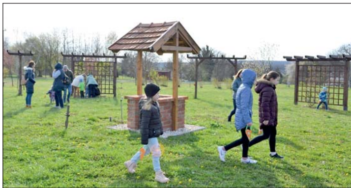
Egy csokitójás sem maradt a Göcsej Parkban.

Bolygó Klímavédelmi Alapítvány kuratóriumi elnöke. A volt államfő a fenntarthatósági témahét rendezvényén 170 tanuló előtt beszélt, időről időre megkérdezve hallgatóságát, a helyesnek gondolt válaszokat pedig mobiltelefonon lehetett megjeleníteni. Így került szóba a 6. tömeges kihalás, ami napjainkban zajlik, hogy 41 ezer veszélyeztetett fajt tartanak számon a szakértők, hogy az élelmiszereink 40 százaléka tűnik el, ha nem lesznek beporzó rovarok, márpedig folyamatosan fogyatkoznak. Mindez az ipari forradalom kezdete, 200 éve zajló emberi tevékenység következménye.