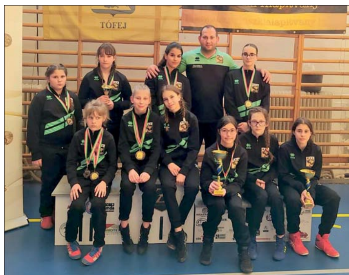
A nagyszerűen szereplő tófeji versenyzők edzőjükkal.