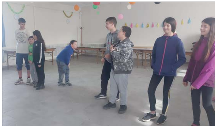
A fiataloknak is szerveztek programot.