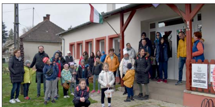
Közel 50 fős csapat gyűlt össze.

A húsvéti nyuszi meghívót küldött a helyi gyerekeknek, hogy nagypéntek délelőtt várja őket a kultúrház előtt. A közel 50 fős csapat lelkesen követte a nyuszitalpakat, cukrokat, amiket a nyuszi potyogtatott. A gyönyörű időben rohanva teljesítették a gyerekek a feladatokot, amik az egyes állomásokon vártak rájuk. Volt, ahol labirintust fejtettek meg, más-hol képkeresőztek. A kisfiúk és az apukák locsolóverseket