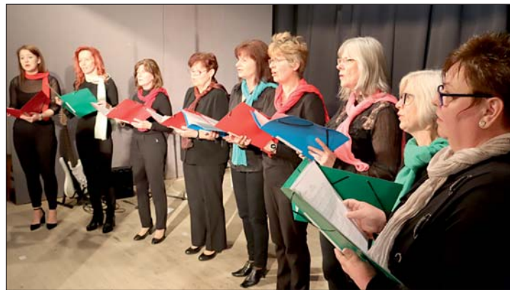
A kamarakórus is fellépett.

Tevékenységük fontos része a kirándulás, az elmúlt 20 évben felfedezték az ország minden megyeszékhelyét és környékének nevezetességeit. Határon túli magyarlakta vidékekre látogattak el, így eljutottak Prágába, a Felvidékre, betutatták Kárpátalja, Erdély, és a mai Ausztria területét. A Gellénházi Nők Egyesületének feladata a Szent Iván Napi Falunap szervezése, melynek mindig szívesen és lelkesen tesznek eleget. A település virágosítását is felvállalták és más társadalmi munkákban is aktívan részt vesznek. Az egyesület keretén belül működött az Orchidea Kamarakórus , amely erre a jubileumi rendezvényre újra összeállt. Húsz év elteltével is legfőbb céljuk, hogy