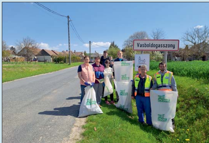
Hulladékszedő önkéntesek Vasboldogasszony határában néhány nappal ezelőtt.

– A legkritikusabb helyszíneink továbbra is felszámolásra várnak: Cserszegtomaj-Keszthely volt okkerbánya; T.J.L. Gumirec Lenti, zajdai laktanya területén gumi hulladék; Nagykanizsa, Principális-csatorna környezete. Utóbbi időben változás történt Lenti esetében. A jegyző véglegessé vált döntésében visszavonta a T.J.L. Gumirec Kft. telepengedélyét, majd hatóságunk a törvényes feltételek hiánya miatt visszavonta a cég hulladékgazdálkodási engedélyét. A mi visszavonó engedélyünk is véglegessé vált. Ebben a döntésünkben 2023. június 30-ig adtunk határidőt a telep felszámolására, illetve a hulladék teljes elszállítására, az eredeti állapot visszaállítására. A cég előéletét ismerve féltő, hogy itt