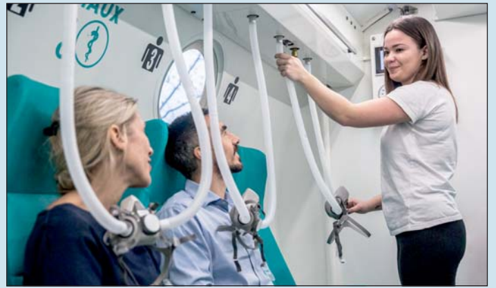
Az országban egyedülálló a berendezés.

– Gyakran alakul ki krónikus fáradtság, alvászavar, memória probléma, „agy kód”, koncentrációs probléma, szorongás, szubjektív légszomj érzés, szívritmus probléma, szag- és ízérzés zavar, fájdalom szindróma. Sok más tünetet és pszichoszomatikus elváltozást is okoz. A panaszokra eddig csak tüneti terápia létezett: