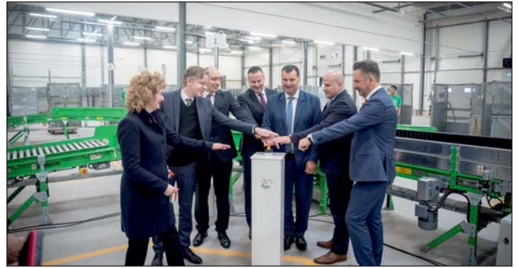
Indul a rendszer...

– Az elmúlt években folyamatosan fejlődött Zalaegerszeg gazdasága. Amikor 2014-ben a jelenlegi városvezetés megkezdte a munkát, első és legfontosabb feladatának a gazdaság fejlesztését és az új munkahelyek létrehozását tartotta. Az elmúlt 9 évben több tízmilliárd forint értékben valósultak meg beruházások és 4.400 új munkahely jött létre. A munkanélküliség aránya a 2014-es 7,5 százalékról 2022-re 2,6 százalékra csökkent. A város helyi iparüzési adóbevétele (a gazdaság fejlődésének egyik legjobb fokmérője) 75 százalékkal nőtt; 2014: 3 milliárd Ft, 2019: 4 milliárd Ft, 2023: 5,6 milliárd Ft. Az eddigi információink alapján 2022–2024 között további 1.700 új munkahely jön még létre. Olyan gazdasági ökoszisztéma alakul ki Zalaegerszezen, ahol jelen van és összekapcsolódik a termelés, a kutatás-fejlesztés, az innováció, a szakképzés, az egyetemi oktatás, valamint a különféle szolgáltatások – tájékoztatta lapunkat Balaicz Zoltán, a vármegyeszékhely polgármestere.