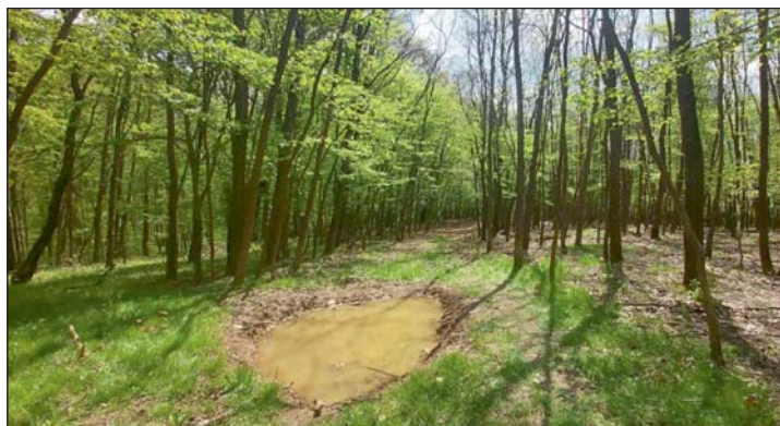
Csodálatos tájakon keresztül vezetett az út.

2023. április 22-én harmadik alkalommal rendezte meg a Petrikeresztúri Közösségfejlesztő Egyesület és a település önkormányzata a Tavaszi szomszédoló túrát. A program célja Göcsej természeti értékeinek népszerűsítése, a helyi értékek megismerése.