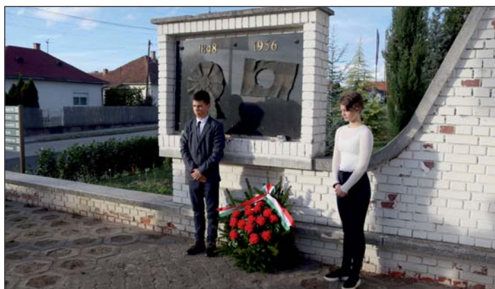
Emlékezés az ünnepnapokon.

A legkisebbeket Mikulás város rendezvény hangolja a téli ünnepekre. A „reptéri” parkoló-