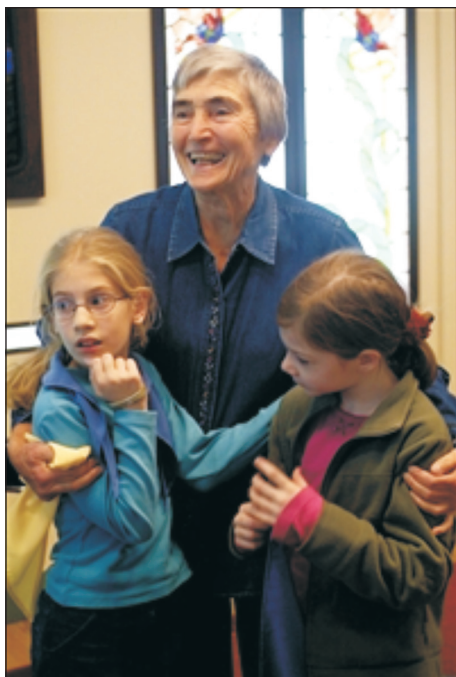
Elhivatott asszony volt.

Huszonnyolc gyerek érkezett a táborba, jöttek Kaposvárról, Keszthelyről, Kanizsáról, Vácról és Texasból. A gyerekek 4-től 14 éves korig – miközben Beethoven zenéjét hallgatták – lelkesen és mélyen