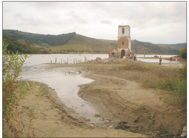
A tó a katolikus templom csonka tornyával.

Érkezésünkhöz képest a tavat zötyögős úton megkerül-