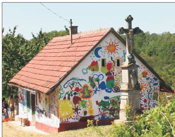
A zalaszabari „festett” pince.

koncentráva festették gondolataikat, érzéseiket Zoli bácsi présházára. A végeredményt, mint Zalaszabar egyik valóban