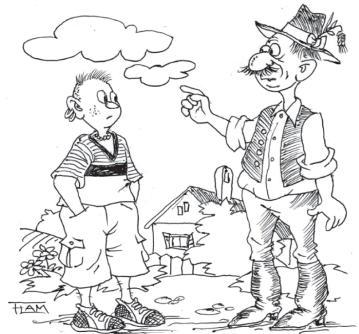
Farkas László illusztrációja

– Tudod, kisonokám, nekünk még csak palatáblánk volt, de ha álmomból ugrasztanak fel, akkor is tudom, hogy mennyi hétszer nyolc!