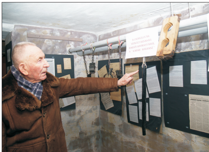
Fogdamúzeumot hozott létre.

Nem volt könnyű élet az övé, s maga sem volt könnyű ember.