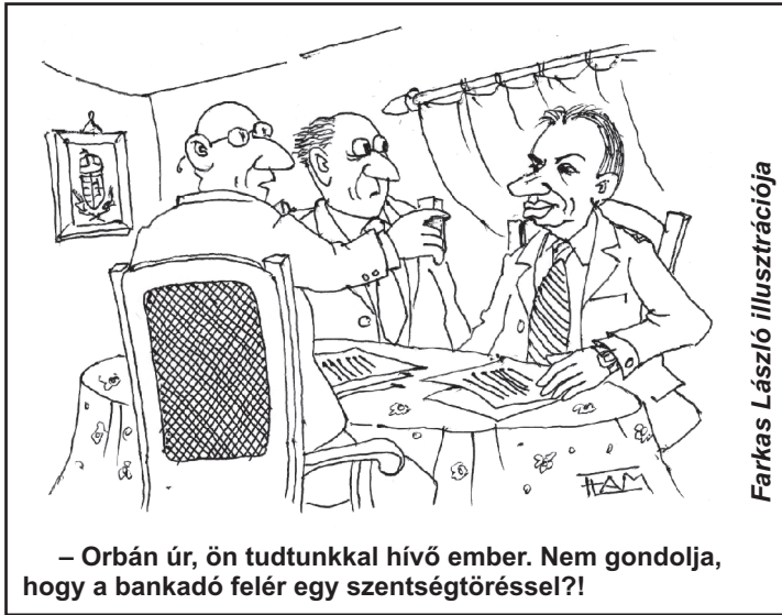
Farkas László illusztrációja

Nagybankok, hitelminősítők, az IMF és Magyarország