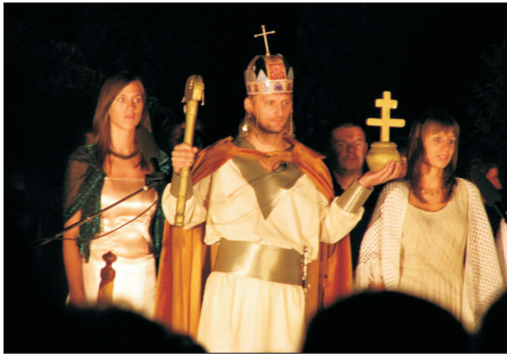
István, a király a petrikeresztúri amatőr színjátszók előadásában az elmúlt évben.