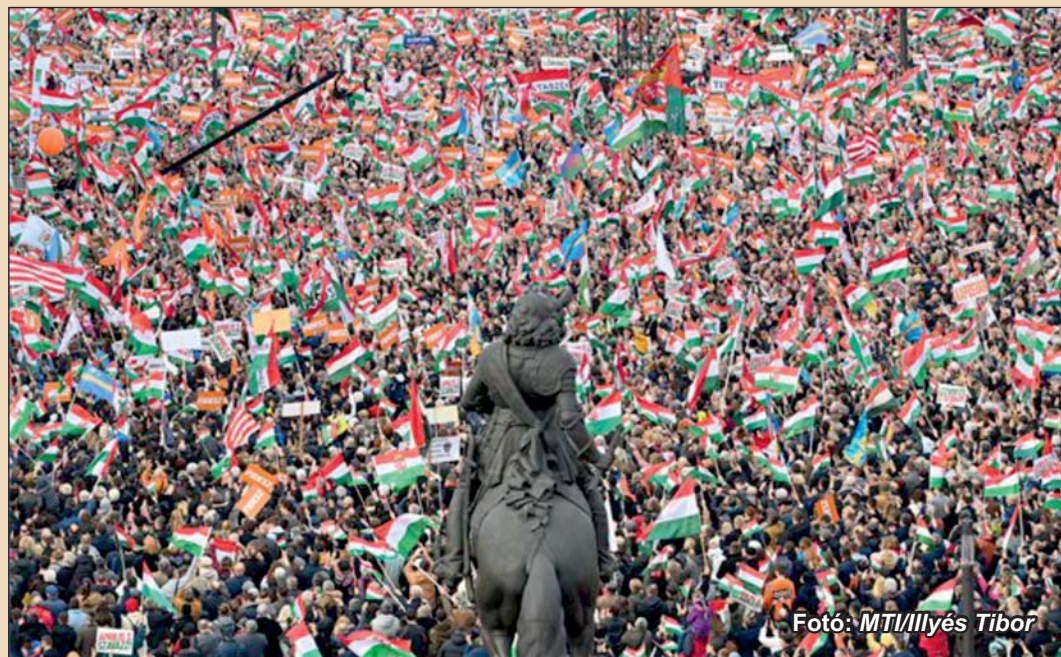
Fotó: MTI/Ilyés Tibor

„Magasba a zászlókat, fel győzelemre, a Jóisten mindannyiunk fölött, Magyarország mindenek előtt, hajrá, Magyarország, hajrá, magyarok!” – zárta ünnepi beszédét Orbán Viktor. (Forrás: MTI)