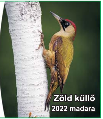
Zöld küllő 2022 madara

Megyei havilap XXXIV. évfolyam 848. szám 2022. 03. 17.