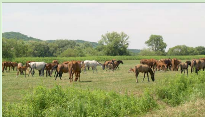
A ménés őshonos lófajtából áll.