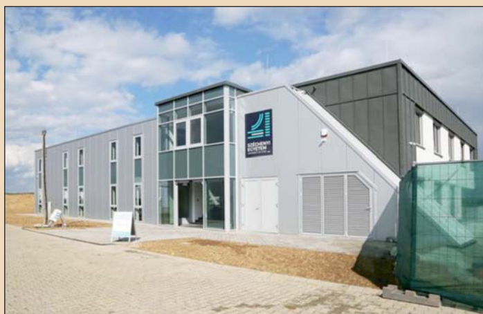
A Széchenyi István Egyetem inkubációs és szállásépülete a ZalaZone tudományos és innovációs parkban Zalaegerszegen az átadás napján, 2022. szeptember 12-én.

„Nem túlzás azt állítani, hogy Magyarország versenyképessége és jövője nagyban függ az egyetemektől és az ott zajló munka minőségétől” – fogalmazott Szijjártó Péter .