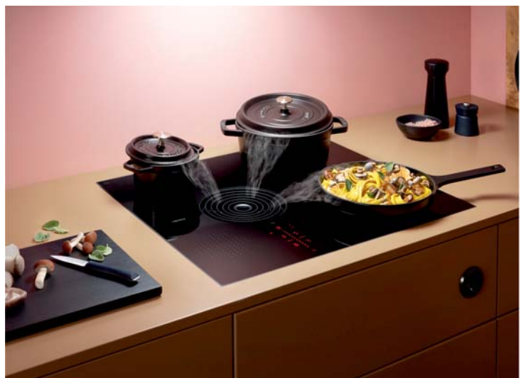
BORA – főzőlapba süllyesztett páraelszívó rendszer Kizárólagos dunántúli forgalmazás!