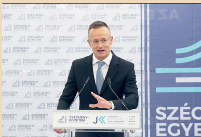
Szijjártó Péter beszédet mond a Széchenyi István Egyetem inkubációs és szállásépületének átadásán.