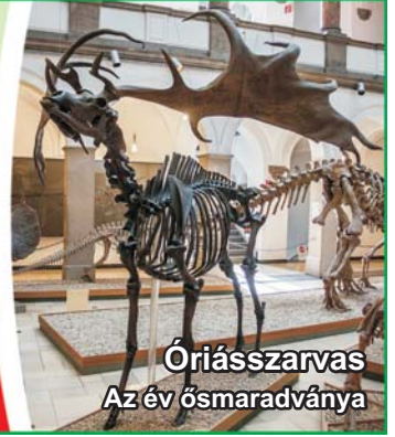
Óriásszarvas Az év ősmaradványa

Megyei havilap XXXIV. évfolyam 854. szám 2022. 09. 15.