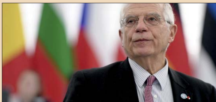
Josep Borrell... Valóban ez most az EU legfontosabb problémája?

A szeptember 17-re tervezett belgrádi Europride nevű európai meleg büszkeség felvonulással kapcsolatban az Európai Unió arra bátorítja a szerb hatóságokat, hogy keressenek megoldást a szerve-