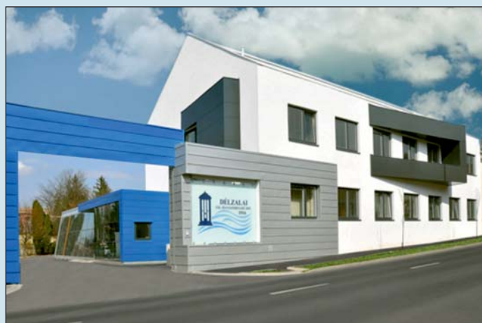
Közeleg a határidő...

Ez még tavaly elment – minden erkölcselensége ellenére. A jövőben viszont a meg-