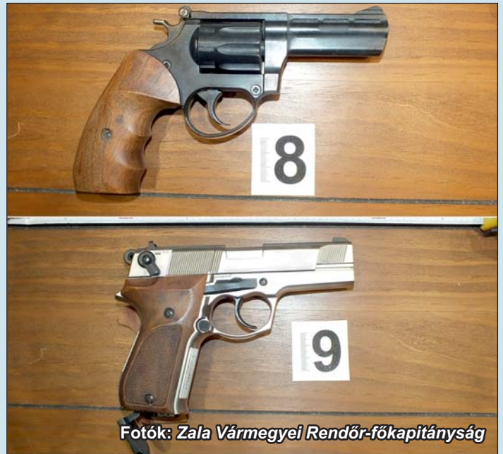
Fotók: Zala Vármegyei Rendőr-főkapitányság

A nyomozás vizsgálati szakaszában a Zalaegerszegi Rendőrkapitányság a szükséges eljárási cselekményeket elvégezte, és az iratokat vádemelési javaslattal megküldte az illetékes ügyészségnek. (Forrás: Zala Vármegyei Rendőr-főkapitányság)