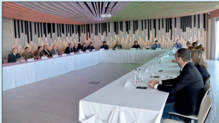
A Zala Megyei Területi Védelmi Bizottság kihelyezett ülése 2022 október 27-én Zalaszabaron.

– A települési polgármesterek kijelölnek egy – legalább középfokú végzettséggel rendelkező – lakost, aki vállalja, hogy részt vesz a képzésen. A Honvédelmi Minisztérium Védelmi Igazgatási Főosztálya a felkészítő előadásokat online formában tette elérhetővé a képzésben részt vevők számára, míg a Zala Vármegyei Területi Védelmi Bizottság egy általános online felkészítő dokumentumot és a hozzá tartozó kérdőívet biztosít, melynek megismerésével a jelöltek olyan alapismeretekre tehetnek szert, amelyek segítik a szakmai előadások mélyebb szintű megértését. Ezzel azonban még nem ér véget a képzés, ugyanis egy