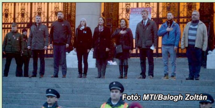
Egy igazi szakértői csapat, mint a mesében... Legyen is beruházás, meg ne is legyen. Kár, hogy bezárt a Lipótmezői tébolyda...

Dunai hajózás – környezet-szennyezés. Közúti árufuvarozás – környezetszennyező. Budapest–Belgrád vasútvonal – rémes, felesleges, diktatúra! Vadászat, vadászati turizmus – barbárság, jaj kicsi Bambi...!