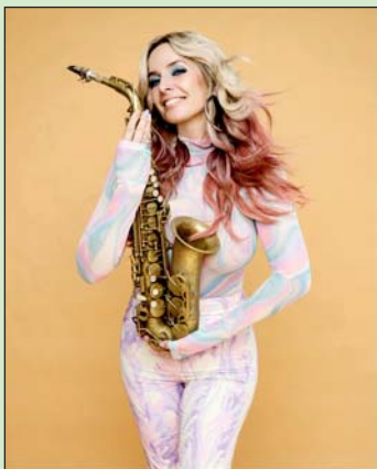
Candy Dulfer a '90-es évek elején robbant be a zenei világba.

Magyarország legújabb fesztiválját, az Örvényesvölgy Fesztivált, 2023. júniusában, két hétvégén, 9-10-én és 16-17-én tartják Zalacsányban. Gyönyörű környezetben, a zalai dombok között, meghitt hangulatban, limitált számú közönség előtt lépnek fel a zenészek. Öt külföldi sztárvendég érkezik majd Zalacsányba, köztük a jazz, a soul, blues és az elektro-swing legnagyobb-