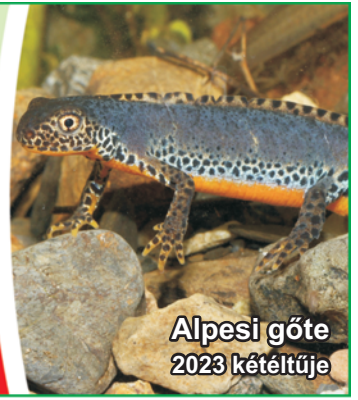
Alpesi gőte 2023 kételtűje

Megyei havilap XXXV. évfolyam 860. szám 2023. 03. 16.