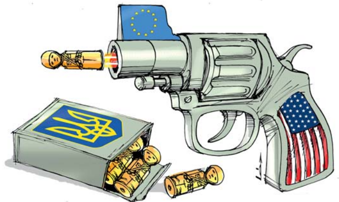
Rajz: Léphaft Pál