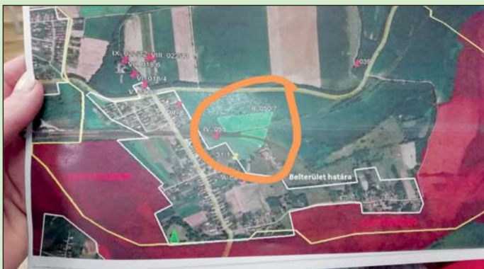
A többség a rajzon látható területet javasolta.