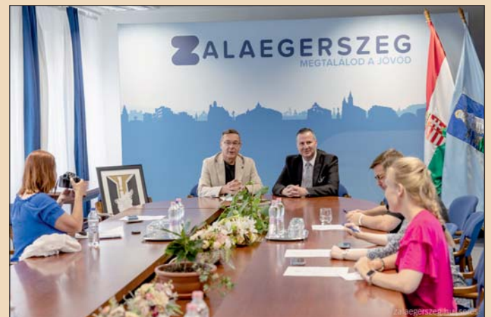
Sajtótájékoztatón számoltak be az eseményről.