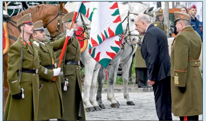
Sulyok Tamás köztársasági elnök beiktatási ünnepségén a budapesti Szent György téren 2024. március 10-én. Jobbra Boröndi Gábor vezérezredes, a Honvéd Vezérkar főnöke.

Kiemelte: köztársasági elnökként is az alaptörvény lesz munkája sarokpontja, kerete és mércéje, amely pedig pontosan megfogalmazza, hogy a köztársasági elnök kifejezi a nemzet egységét és örökődik az államszervezet demokratikus működése felett. „Ez az egység az, amit nem lehet és nem is engedek megbontani” – hangsúlyozta, hozzátéve: „ez a működési forma az, amelynek keretei között értelmezem a szolgálatom, és melynek határait következetesen fogom őrizni és nem engedem átlépni.”