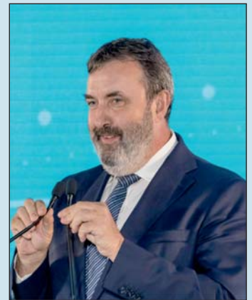
Palkovics László beszédet mond az alapkövetéti ünnepségen.

Vigh László országgyűlési képviselő egybekel mellett arról beszélt, hogy 255 hektáron épült fel az elektromos és önvezető autók számára készült tesztpálya, amelyhez év végére elkészül az ovális pálya is.