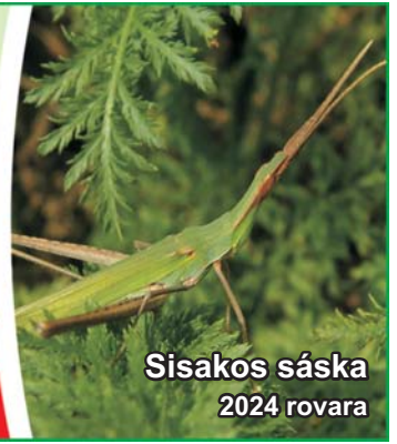
Sisakos sáska 2024 rovára