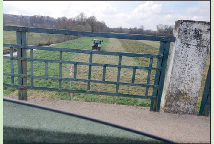
A fotó megörökítette „munka” közben a traktort.