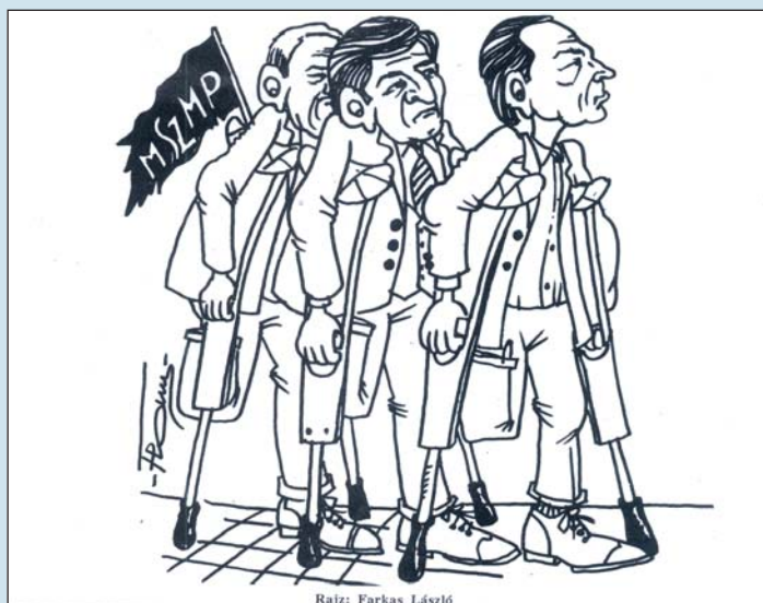
Rajz: Farkas László

Ám ezt szívesen meg tesszük azokkal a magukat