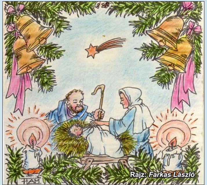
Rajz: Farkas László

Magyarázhatatlan az a csoda, ami így a december ólomléptű lassúsággal múló napjainak vége felé, a születés napja idején hatalmába keríti bensőnk. Mintha valami mágus űzne velünk titokzatos varázslatot, egyszerűen lefoszlik rólunk sötét hónapok szennyeje, s kalitkából szabadult rabma-