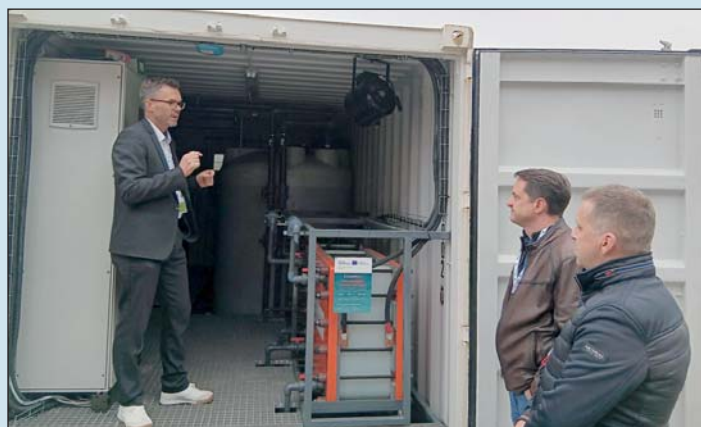
Energiatároló rendszer Weizben.