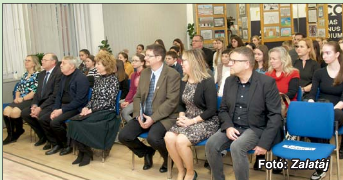
Az eredményhirdetés résztvevői.