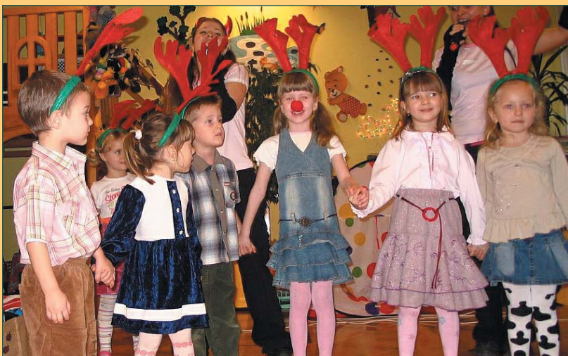
Az Őszköszöntőről ismert Zsuzsival és Orsival köszöntötték az óvodások a Mikulást