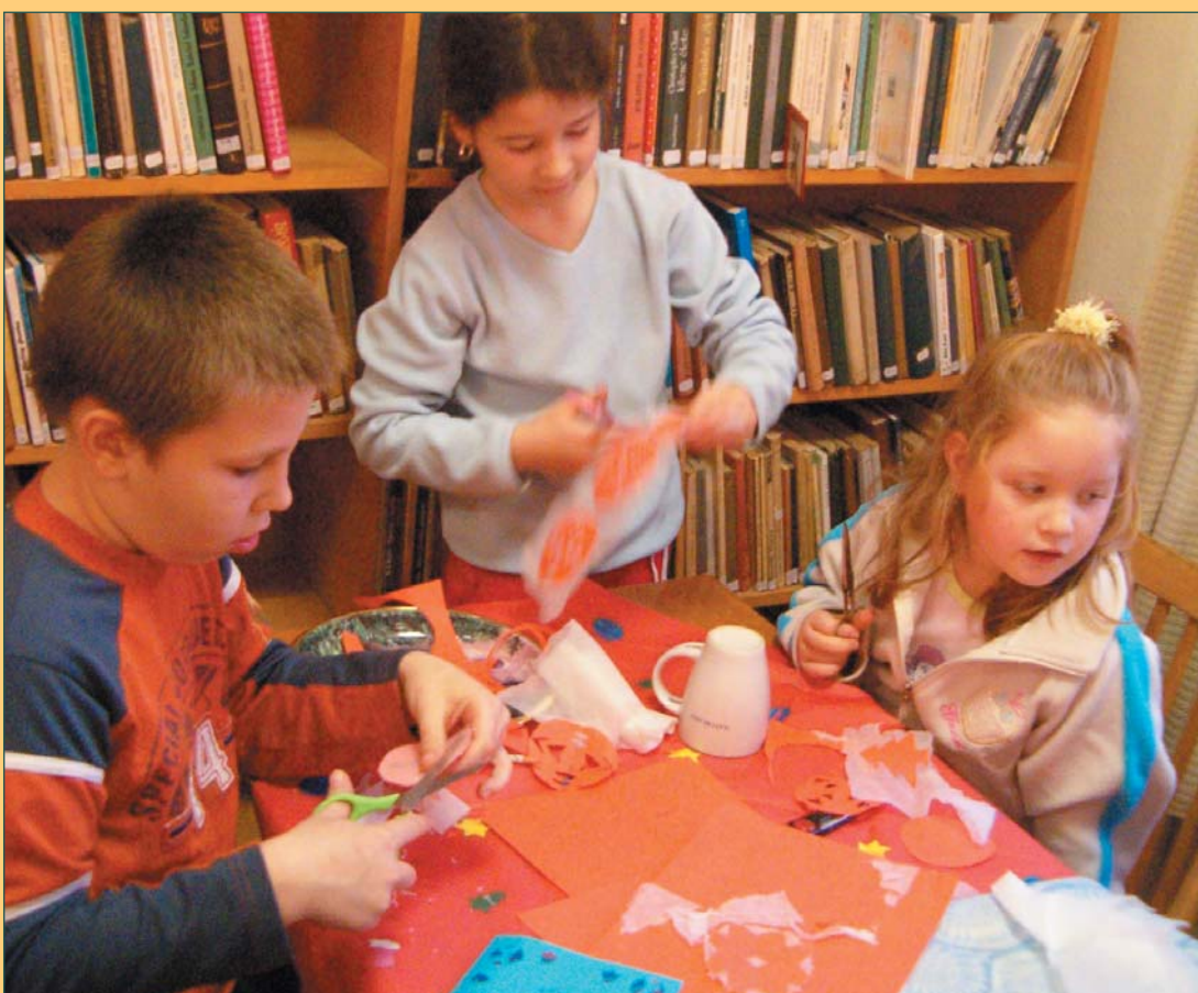
A Könyvtár ismét megtartotta kétnapos karácsonyi készülődését, amin már több mint 150 gyermek vett részt