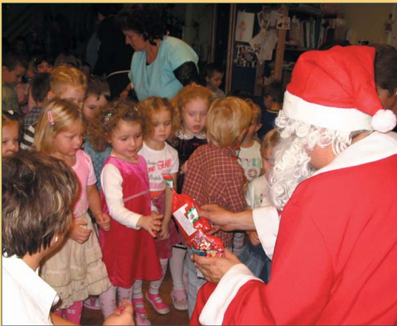
Minden óvodás gyermek megkapta a csomagot a Mikulástól. Képeken a kiscsoportosak láthatók