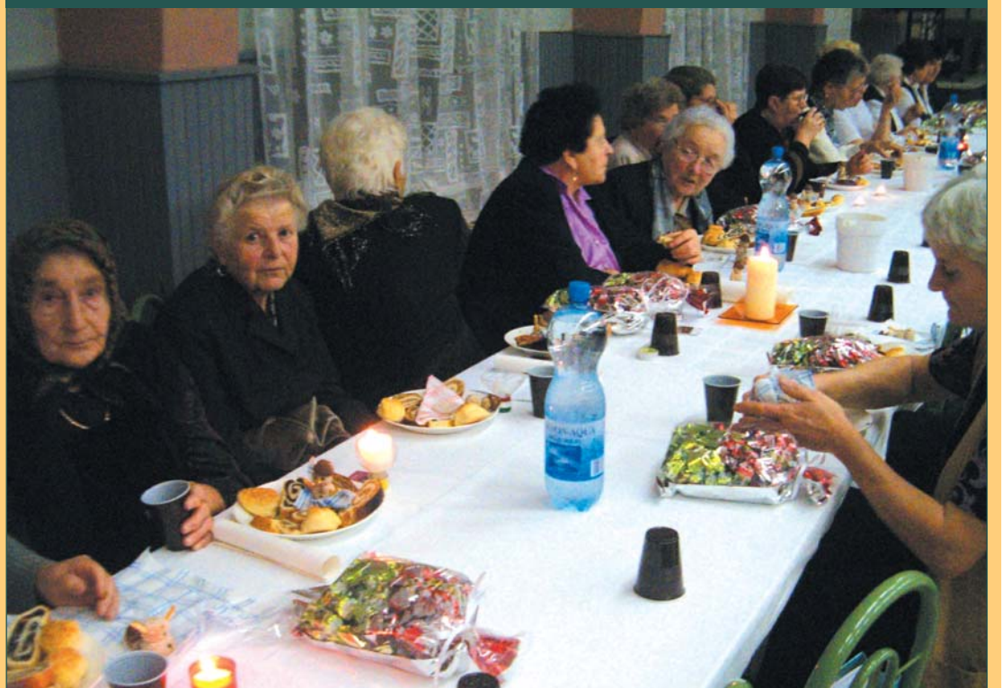
Bensőséges ünnepet tartottak a Nyugdíjas Klub tagjai