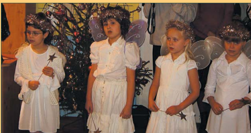
A hagyományokhoz híven, így jelentették meg Jézus születését 2008 karácsonyán az óvodások