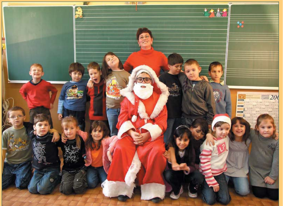
Az iskolában is járt a Mikulás