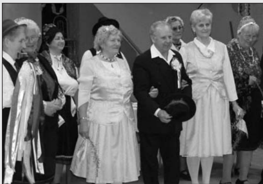
A Községi Ház Nyugdíjas Klubja igazi lakodalmi hangulatot varázsolt a farsangi bálba