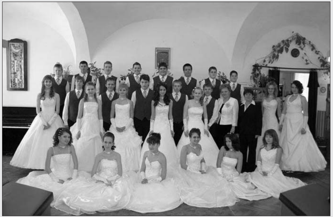
A hagyományokhoz híven idén is a Battbyány József Általános Iskola végzős tanulói nyitották meg az Iskolai Bált