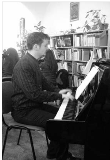
Képünkön a Senza Dirigente Kamarazenekar játszik

Idén először került megrendezésre a Magyar Kultúra Napja a Könyvtárban 2009. január 24-én. Fellépők voltak: