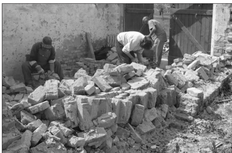
A közmunkások egy romos épületet bontanak le

hulladékgyűjtésben, csapadékvíz elvezetésében, bontási munkákban és temető karbantartásában vesznek részt, hogy a településünk rendezett legyen. Ezeket a munkákat az önkormányzat biztosítja a hatvani Munkaügyi Központtal együttműködve. Ezáltal a munkanélküli emberek keresethez jutnak, az önkormányzat pedig lehetőséget kap arra, hogy rendezett, tiszta falut alakítson ki.