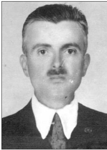
...katonai igazolványából 1957.,...