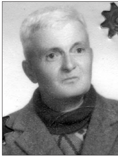
...arcképes igazolványából 1970-es évek.