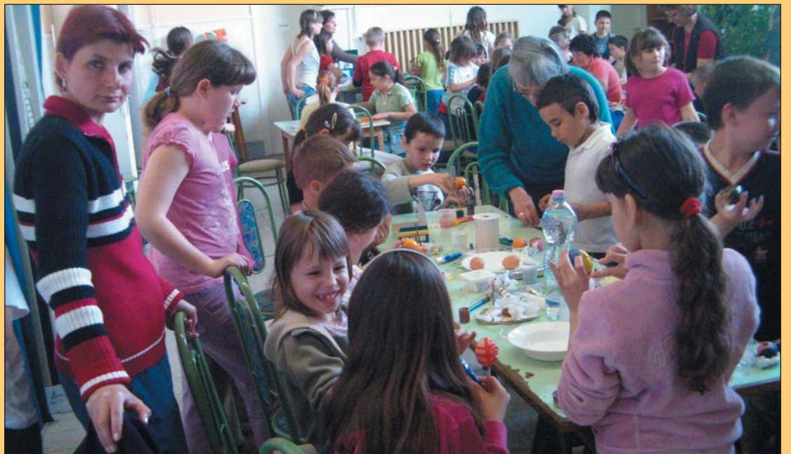
Kicsik és nagyok egyaránt szívesen jöttek el a Játsszóházba