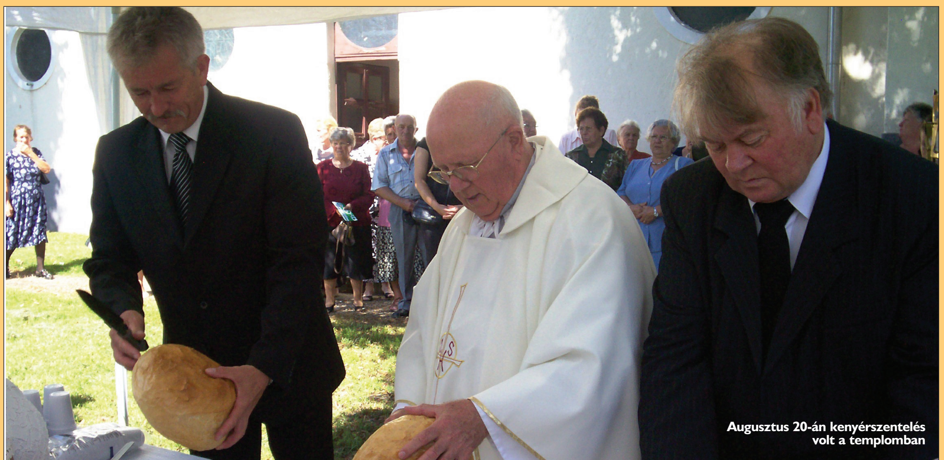
Augusztus 20-án kenyérszentelés volt a templomban