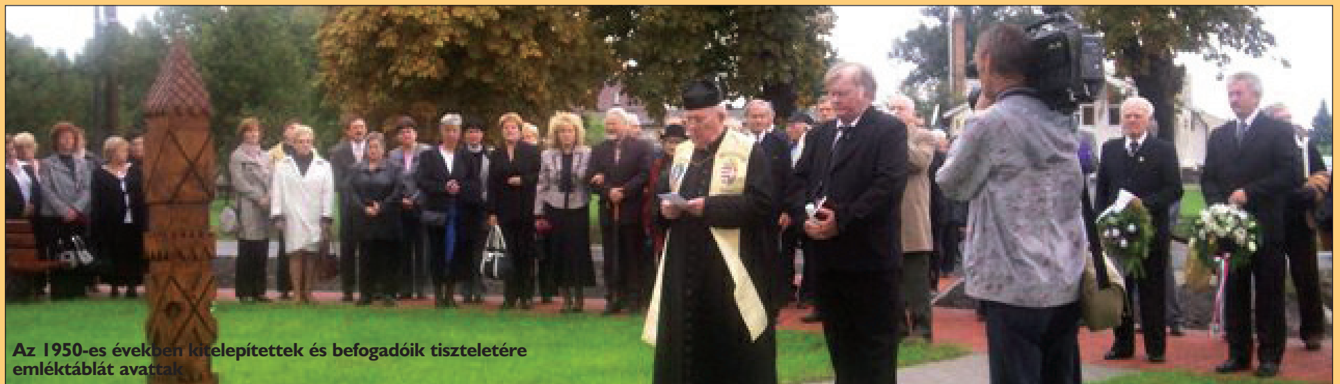
Az 1950-es években kitelepítettek és befogadók tiszteletére emléktáblát avattak