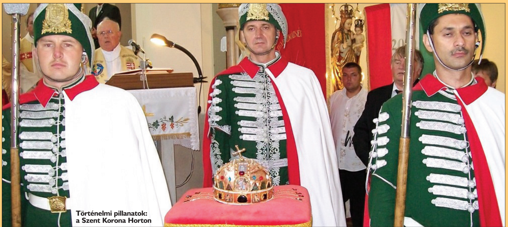
Történelmi pillanatok: a Szent Korona Horton