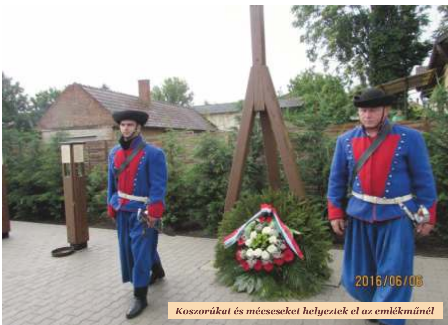
Koszorúkat és mécseseket helyeztek el az emlékműnél