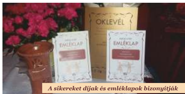
A sikereket díjak és emléklapok bizonyítják