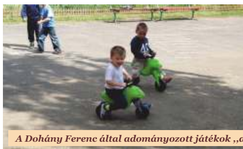
A Dohány Ferenc által adományozott játékok „akcióban”