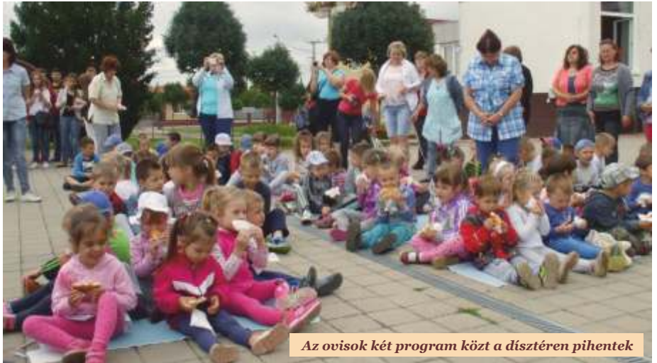
Az ovisok két program közt a dísztéren pihentek