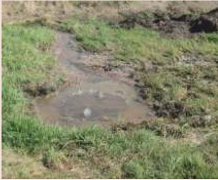
Hort Nagyközség Önkormányzata

A szennyvízesatorna rendszer kiépítésétől kezdve két pozícióban, a Rét úton, és a Határ úton évente több alkalommal kiömlött a szennyvíz. A Heves megyei Vízmű Zrt. megvizsgálta ezen szakaszokat, és olyan intézkedést hozott, amivel ezek a problémák megszűnnek. A Rét úti szennyvíz végátemelőben nagyobb teljesítményű szivattyúkat és nagyobb átmérőjű szerelvényeket építettek be. Remélhetőleg ezek a vízgépészeti átalakítások biztosítani fogják a rendszer zavartalan működését. A hibajelentést SMS-ben kapja meg a vízmű, hogy a szükséges beavatkozást időben elvégezhesse.