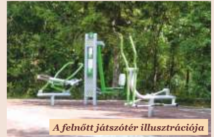
A felnőtt játszótér illusztrációja

Pályázott az Önkormányzat két felnőtt számára kialakított sportelemek telepítésére. Az elemek egyik része az Egészség Központ melletti területre, másik része a Hősök terén lesz elhelyezve.