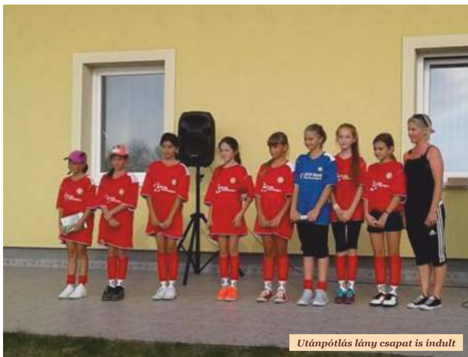
Utánpótlás lány csapat is indult