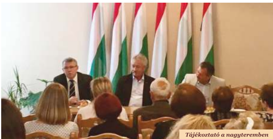
Tájékoztató a nagyteremben