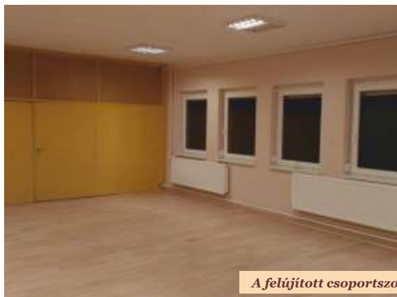
A felújított csoportszoba és az új csatornavíz elvezető