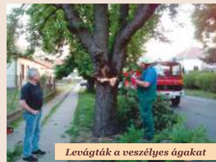
Levágták a veszélyes ágakat

Május 6-án a Bajcsy úti közterületen egy több mázsás súlyú, korhadt ág szakadt le az egyik gesztenyefáról. Személyi sérülés és anyagi kár nem keletkezett. Ugyancsak egy korhadt ág szakadt le a Szabadság téren álló középső gesztenyefáról. Az előbbit a HÖTKE, az utóbbit a Kft. munkatársai eltávolították. A közterületen a lakosság által ültetett, magas növésű fák az életkoruk, vagy a vízszintesen növekvő, nagyszúlyú ágak miatt veszélyesek lehetnek a viharos időjárás idején. Az Önkormányzat megvizsgálja az ilyen fákat, és megteszi a szükséges intézkedéseket a balesetek elkerülése érdekében.