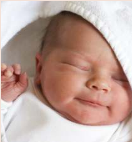
Hort Nagyközség Önkormányzata

Az óvodás és iskolás gyermekek, valamint a középiskolások, főiskolások, egyetemisták tanévkezdési támogatásban részesültek. A támogatás erre az évre vonatkozik, melynek értéke meghaladta a hárommillió forintot.