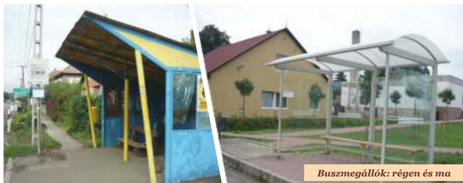
Buszmegállók: régen és ma