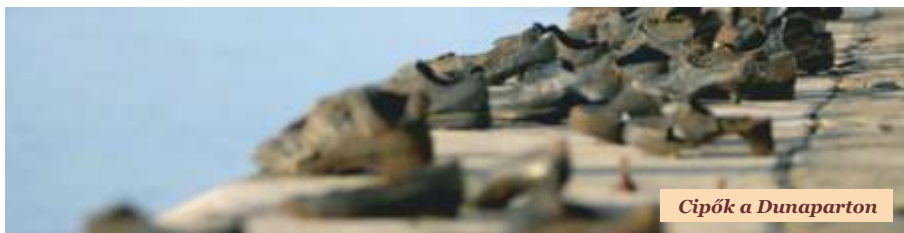
Cipők a Dunaparton