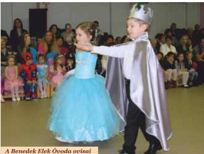
A Benedek Elek Óvoda ovisai