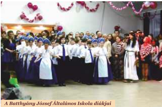
A Batthyány József Általános Iskola diákjai