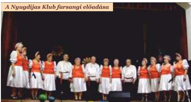
A Nyugdijas Klub farsangi előadása