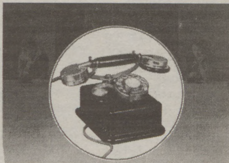
CB 24-es távbeszélő készülék 1924-ből