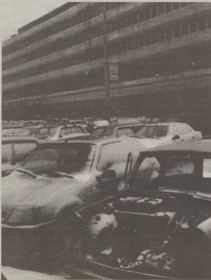
Vandálok a Déli pályaudvar parkolójában

Az érdeklődőknek személyesen, levélben vagy telefonon készségi adnak felvilágosítást az említett rendőri szervek munkatársai.