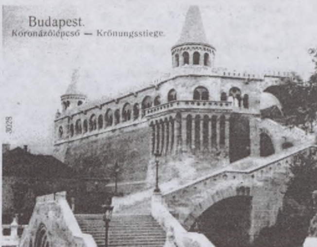
A Koronázólépcső 1910-ben