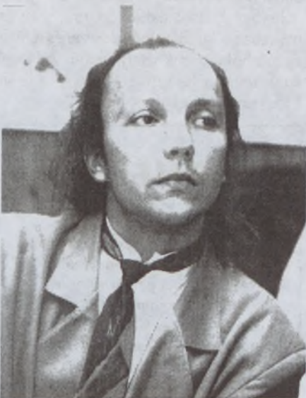
Főző Vilmos, a Fidesz-MPP frakcióvezetője

A napirendi javaslatot szokatlanul gyorsan és szinte egyhangúlag fogadták el a képviselők, némi megkönnyebbüléssel véve tudomásul, hogy a tervezett tizenegy pontból négynek a tárgyalására csak később kerülhet sor. A maradék hét ponttal, gondolhatták, majd csak megbírkózunk este 10-ig. Legutóbb ügyis túlóráztak, két maratoni ülés erejéig.