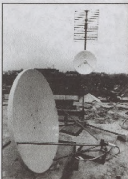
... jellemző kép egy háztetőről – háttérben az AM-mikro vevőantenna

Miképp lehetséges az AM-mikro vétele? Az AM-mikro bár parabolaantennával vehető, nem műholdról „érkezik”, hanem a Széchenyi-hegyi adótoronyból. A hagyományos VHF és UHF tévécsatornák terjedését nem zavarják annyira a házak, a fák vagy a dombok, a mikro-hullámú adások vételéhez viszont ún. optikai rálátásra van szükség. Ez azt jelenti, hogy arról a pontról, ahova a vevőantennát felszerelik, szabad szemmel is látni kell az adótoronyt, a Széchenyi-hegyi adóépület felső két emeletét. Ezért lényeges tehát a felszerelés helyének helyes megválasztása. Ennek megfelelően az AM-mikro vételére Budapesten és környékén (kb. 26 km sugarú körben) van lehetőség. Az AM-mikro megfelelően szerelt (és elosztott) vevőberendezés esetén a földi vétellel, ill. a kábeltelevíziós hálózatokkal azonos képminőséget biztosít. Lehetőség van arra is, hogy egyetlen vevőberendezésről több család tévéje is működtethető legyen. Így egyrészt a költség takarítható meg, másrészt könnyebben található az antenna elhelyezésére alkalmas pont. Egy olcsóbb AM-mikro vevőberendezés ára jelenleg 10-15 ezer forint körül mozog, mellyel már elfogadható minőségű vétel valósítható meg (természetesen szakszerű szerelés esetén). Léteznek természetesen drágább berendezések is, ahol a vétel minősége, stabilitása már professzionális, de még ezek ára is csak megközelíti a gyöngébb minőségű, olcsóbb egyedi műholdvevő-berendezések beszerzési költségeit.