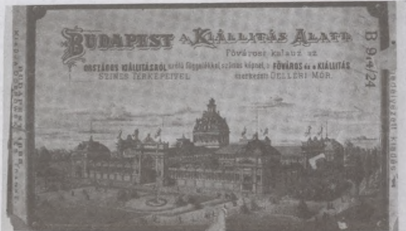
Az Országos Kiállítás kalauzának címlapja 1885.

Lenyűgöző már az első terem: híven illusztrálja, mi minden épült Budapesten a Millennium tiszteletére. Megnyílt a Mátyás templom, a Múcsamok, az Igazságügyi palota, elkészült az Iparművészeti Múzeum, a szecessziós stílus e remeke, a Vígszínház, átadták a forgalomnak a főváros harmadik hidját, amelyet Ferenc Józsefről neveztek el. Nem fejeződött be az országház építése, de a kupolatermében már megtarthatták az „ezredévi díszülést”.