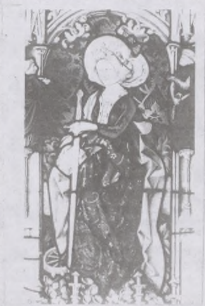
Szent Katalin. Üvegfestmény, Darmstadt

A császár borotvával, vasszögekkel kivert kerekkel akarja szétszaggatni - de a kerekeket villám törte szét. Ennek ellenére a kerék a jámbor hívők szemében a szent halálának jelképe. A kerék miatt vált Katalin a fuvarosok, a bogárnokok, a kerékgyártók, a molnárok és a fazekasok védőszentjévé. November 25-én a kendergyárak, malmok leálltak, a malmosok a templomba mentek. Okossága miatt pedig a diákok, tudósok, egyetemek védőszentje volt. A nagyszombati - majd pesti egyetemen pl. a jogi kar dékánválasztása 1833-ig Katalin napján történt. A bányászok is nagy tisztelői voltak Körömöcbánya, Selmecbánya, Nyitraabánya, Telkibánya plébánia templomainak ő a védőszentje. A helyi monda szerint, amikor az aranyverő Körömöcbánya Katalin templomát talajszüllyedés miatt lebontották, előtte éjjel egy fehéruhás asszony keservesen sírva járkált a templom körül. A sekrestyés megkérdezte: miért sír? Hogyne símek, - felelte a fehéruhás nő - mikor innen el kell költöznöm.