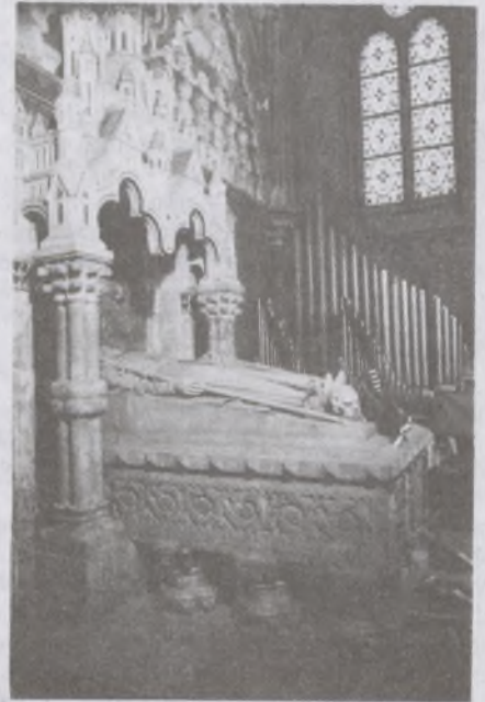
III. Béla és felesége síremléke

Schulek 1919-ben meghalt. A vesztes háború, Magyarország szétdarabolása, a monarchia bukása, az új hatalom új irányzata és a modern építészet meghonosodása a szobrász számára nem sok lehetőséget biztosítottak. Betegen és szegényen tengette élete utolsó éveit, mígnem