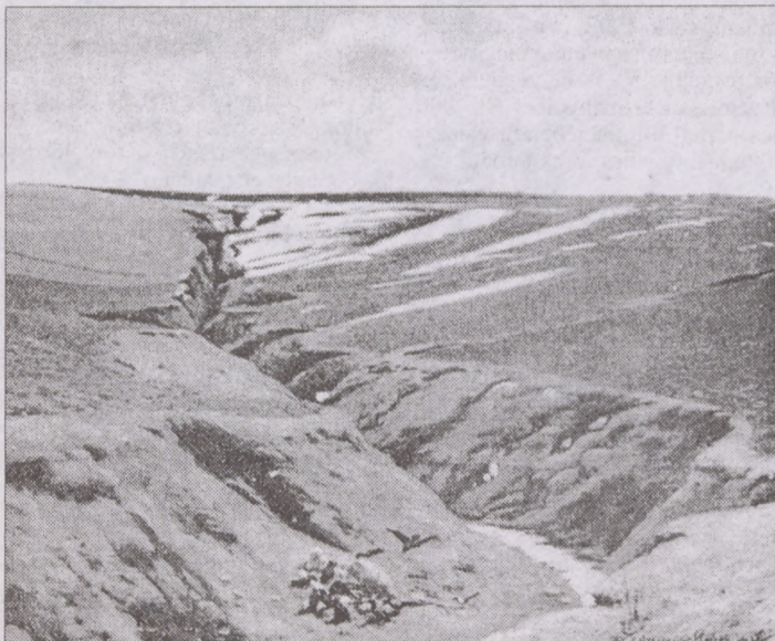
Szinyei Merse Pál: Hóolvadás

Őrző-védőknek és talajmechanikusoknak e baljósan fennkölt fogalmak félelmetesen hétköznapi dolgokat jelentenek. Az örök visszatérés, a feltámadás, az életben tartó sugallatok tán legfontosabbika az, hogy tökéletesen reménytelennek minősített állapotokból is volt feltámadás. Legjobbaink lemondó kétségbeeséssel szemlélték állapotunkat a XVIII. század végén és a következő század elején: „Romlásnak indult hajdan erős magyar