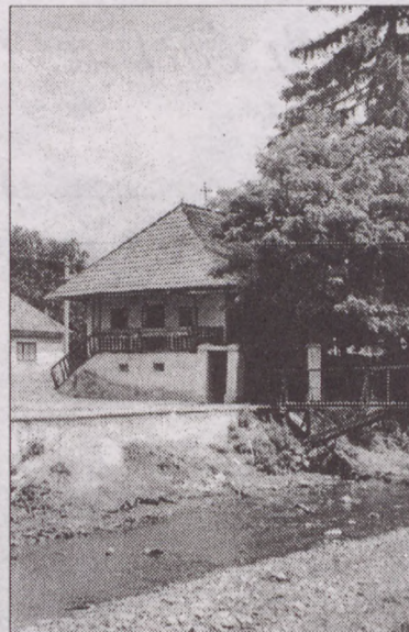
Bereck: Petőfi és Bem találkozásának háza, a patak felől

A hálás utókor napjainkban két emlékhelyet is létrehozott a székely hősnak, aki mindössze 35 évesen ágyúgolyó által vesztette életét az uzoni síkon, a kökösi hídnál. Többszöri nekirugaszkodás után sikerült 1992 nyarán egész alakos szobrot állítani Bereck főterén. A Gábor Áron Kulturális Alapítvány szervezésében gyűjtötték össze a pénzt és 1500 kg bronzot a másfél ember nagyságú szoborhoz. Az alapítvány azóta vett egy kis házat is Berecken , amit Gábor Áron emlékháznak rendeznek be; a későbbiekben néhány szoba vendégfogadásra is alkalmas lesz, főleg ifjúsági cserenyaraltásra. Aki veszi magának a fáradságot, a nyári szabadság alatt látogasson el Erdélybe , keresse a székely ágyúhős emlékeit.