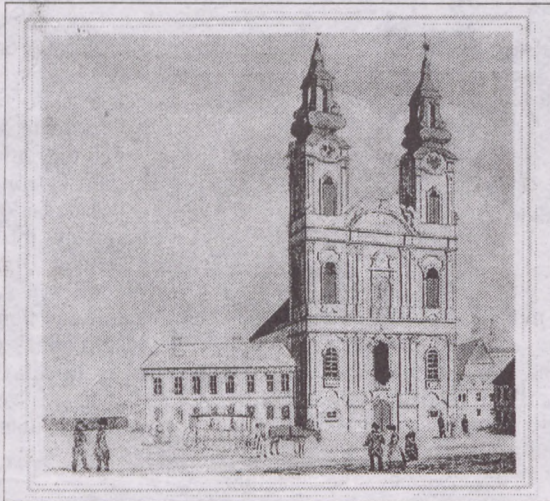
A vízivárosi római katolikus főtemplom 1838-ban készített ábrázolása

- Hogyan érintette a rendszerváltás a honismereti mozgalmat?