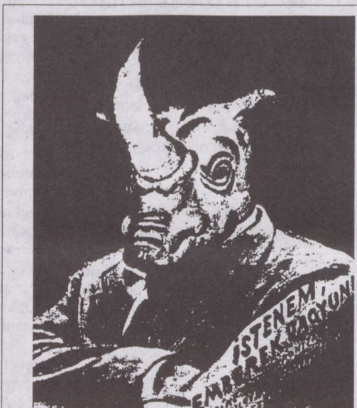
Egy csehszlovák film plakátja

- Nem. Utazni szerettem, de élni máshol nem akartam. A legtovábbi vidék, ahová eljutottam, Peru volt. De csak kuriózum szá-