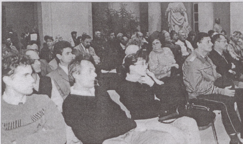
Élénk érdeklődés kísért a polgármester és a rendőrkapitány tájékoztatóját