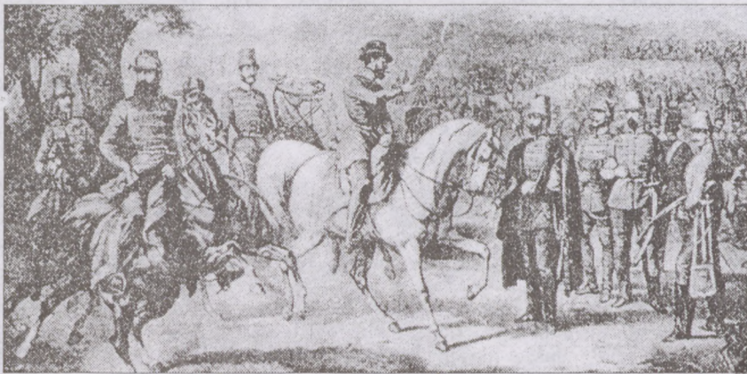
Honvédtábor 1849-ben (ahogy egy angol művész látta)

Munkatársunk fenti írását abból az alkalomból közöljük, hogy elnyerte a Magyar Művészeti Akadémia millenniumi pályázatának díját.