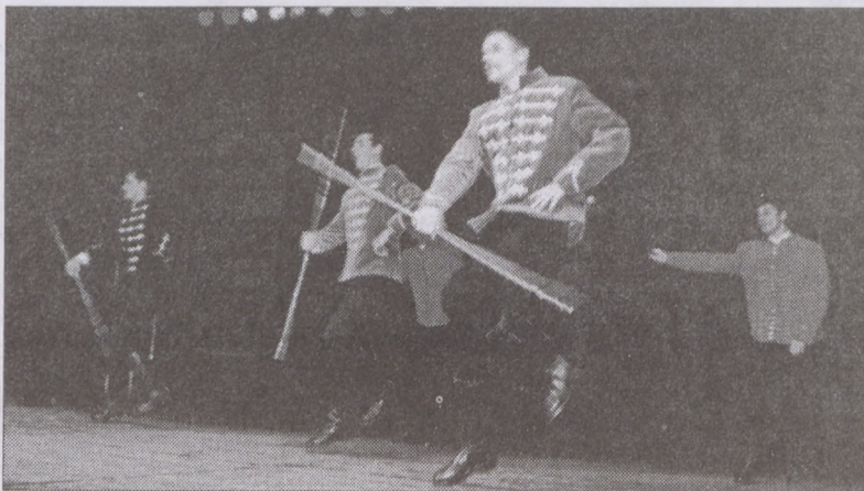
A székelyudvarhelyi Néptáncműhely előadása a Dísz téri színpadon

Kossuth Lajos szavaival búcsúzom: a haza örök, s nem csak az iránt tartozunk kötelességgel, amely van, hanem az iránt is, amely lehet, s lesz.