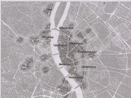
A bankszektor sűrűsödési pontjai Budapesten

Képzelnék el, hogy minden egyes cityképző szektor térbeli sűrűsödési pontjait (például bankokat, számítógépgyártó márkaképviseleteket) külön fóliára rajzolunk, majd az átlátszó fóliákat egymásra rakjuk. A különböző funkciókat különböző színekkel jelöljük. Kapunk egy tarka térképet. Az rt.-nél mindez különleges számítástechnikai programokkal készült.