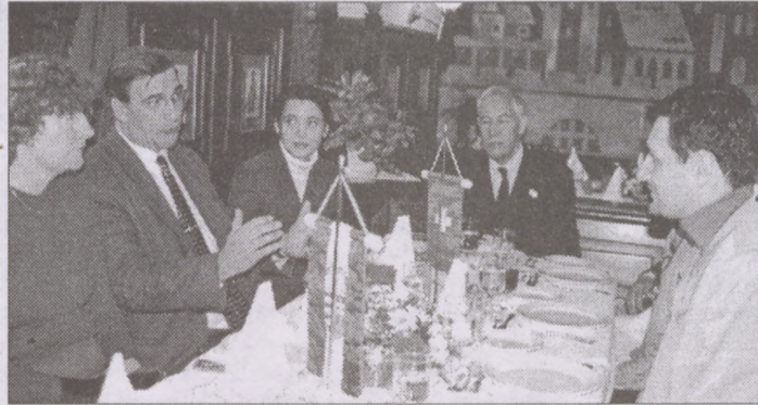
Polgármesterek eszmecseréje fehér asztal mellett

utasítottuk őket. Budavár esetében azonban ez a felkérés megtiszteltetés volt Carouge számára, hogy egy kis svájci város testvércapcsolatban lehet egy ilyen nagyváros, mint Budapest egyik kerületével. Számunkra azért volt érdekes a kezdeményezés, mert a kapcsolattartás nem ígérkezett könnyűnek.