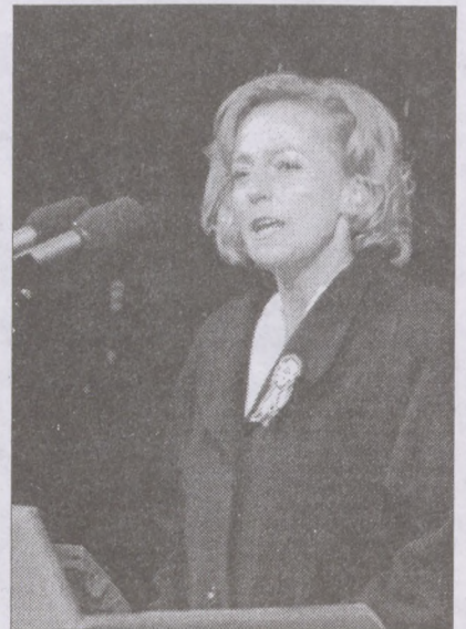
Dr. Dávid Ibolya igazságügy-miniszter

A felelősség nyomasztó súlyával gondolok arra, kik is voltak Ma-