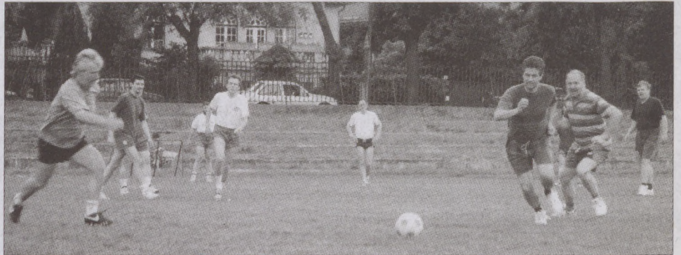
Ezúttal nem a politikai befolyásért, hanem a labdáért küzdöttek a képviselők