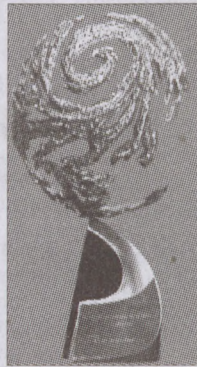
A díj a Földet kívánja ábrázolni a műhold által felvett felhőképpel