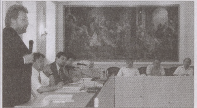
A kibővített bizottsági ülésen az intézmények jövőjéről tárgyaltak

Június 11-én a Kulturális és Oktatási Bizottság rendkívüli ülést tartott, melynek egyetlen napirendi pontja az intézmények átvilágításáról szóló beszélgetés volt.