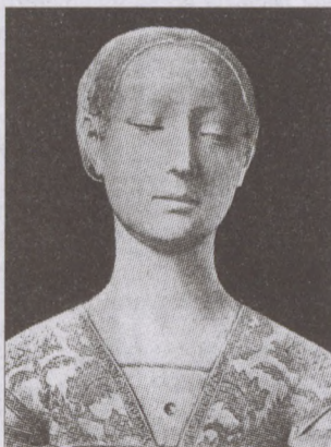
Beatrix leánykori mellszobra

A másik asszony, Aragóniai Beatrix, nápolyi hercegnő, Mátyás felesége. Beatrix 1457-ben született Nápolyban, apja Ferdinánd, olaszosan Ferrante, Calabriai herceg volt, a nápolyi trónörökös, anyja Isabella di Chiaromonte. Gyermekkorra a sötét és komor Castello Nuovóban telt el, és mint testvérei, ő is kiskorától abban a tudatban nőtt fel, hogy dinasztikus érdekű házasságot kell majd kötnie. Mátyás királynak harmadik felesége volt, követvén ebben a minőségben Cillei Erzsébetet és Podjebrád Katalint. 1475-ben történt a házasságkötés, díszes kiildőtség ment a királyi menyasszonyért Nápolyba. Visszafelé az utat a hercegnővel két és fél hónap alatt tették meg, részben hajón, részben díszes, pom-