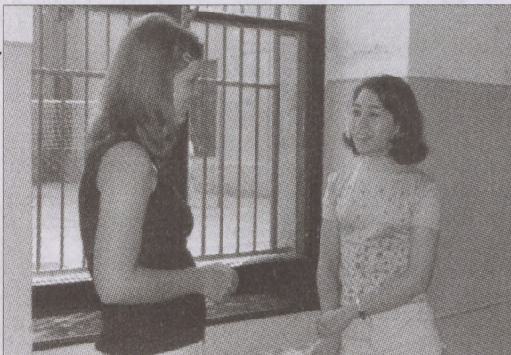
Néha tévét, számítógépet visznek a kirándulásra

dett Bakondi tanár úr. A diákok életében a közösség háttérbe szorult. Tizenévesen karrierépítéssel vannak elfoglalva. Nyelvvizsgát, jogosítványt szereznek, számítástechnikát tanulnak. Ez bizony apasztja a szabadidőt. Másrészt a jókora jövedelmi különbségek miatt nem házibuliznak. Nincs mintájuk arra, hogyan érezzék jól magu-