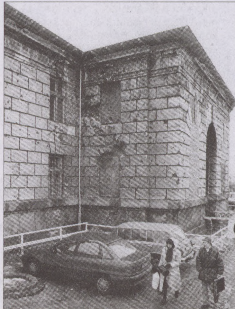
Ezek még háborús sebhelyek

- Már a miniszterelnök februári látogatásakor kiderült, hogy különös figyelmet fordít a Szent György térre. Elég sok anyagot, tervrajzot tanulmányozott át, ada-