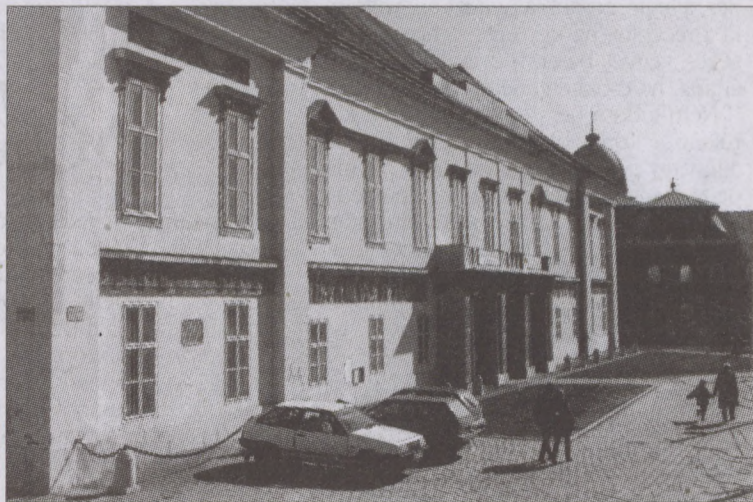
A Sándor-palota miniszterelnöki rezidencia lesz a jövőben

- Az itt élőket régóta sújtja a bizonytalanság, hiszen évtizedek óta elmaradt a felújítás, az elmúlt évek-