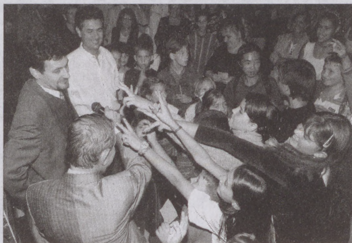
Nagy sikere volt a tombolának