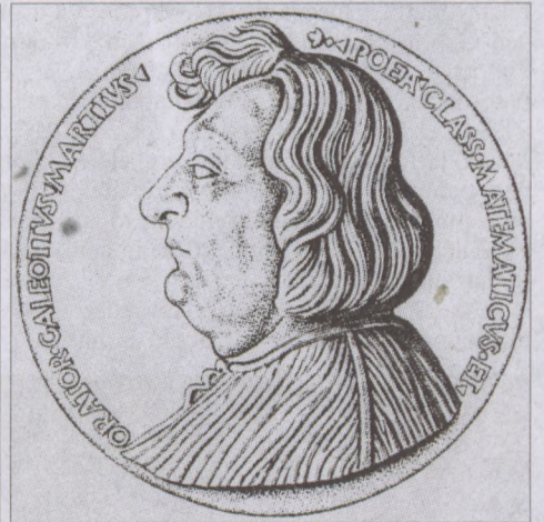
Marzio Galeotto, Mátyás király udvari humanistája

A harmadik ember, akivel foglalkozunk, egyértelműen természettudós volt. Ő Johannes Müller, ismertebb nevén Regiomontanus, német csillagász és asztrológus. A Regiomontanus nevet szülővárosa, Königsberg latin neve után vette fel. 1467-től 1471-ig élt és dolgozott Mátyás udvarában. Korszerű csillagászati táblázatokat állított össze, és itt, Budán írta az Ephemerides című csillagászati művét, mely többek közt Kolumbusnak is kalauzul szolgált utazásai alkalmával. Budai tartózkodása előtt több évet töltött Esztergomban és Pozsonyban, a pozsonyi egyetemnek tanára is volt. Csillagászatként működése mellett segítkezett Mátyás Corvinának rendszerezésében, leginkább a görög kéziratokkal foglalkozott. Egy-