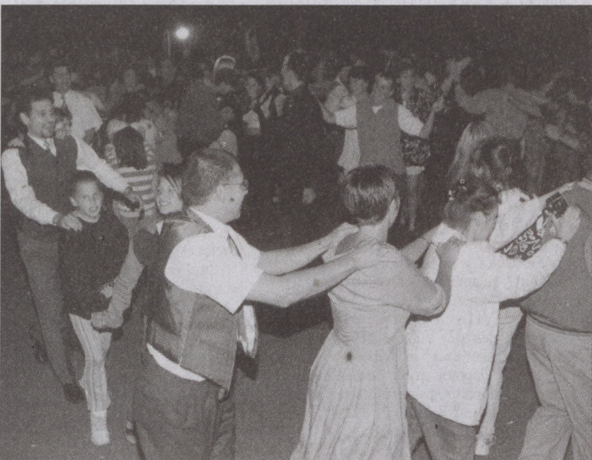
Zaklatol a „szerelemvonal”