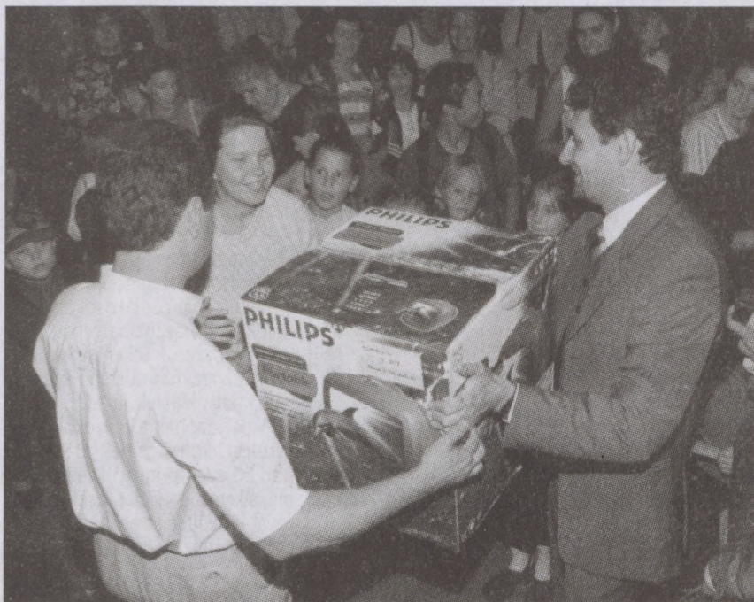
Átadják a tombola fődíját