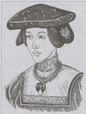
Habsburg Mária királyné, II. Lajos özvegye, utóbb Németalföld kormányzója Hans Krell munkája

Mária 1529-ig Pozsonyban élt mint Magyarország helytartója. Ekkor már két király tartott igényt a trónra, és ebben a zűrzavaros időben, általános fejtelenségben Mária szegényes pozsonyi udvartartása szilárd pontnak bizonyult. 1530-ban testvére, a nagyhatalmú V. Károly császár, "akinek birodalmában sohasem nyugodott le a Nap", arra kérte Máriát, hogy foglalja el Németalföld helytartói székét. Mária, az özvegy magyar királyné ekkor Európa iparilag legfejlettebb országának élére került.