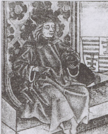
IV. Béla képe a Turóczy krónikában

A király és családja 1242-ben tért vissza Magyarországra miután a tatárok amilyen gyorsan jöttek, olyan gyorsan el is takarodtak a Kárpát-medencéből. Béla zseniálisan rájött, hogy egész addigi politikáját, stratégiáját meg kell változtatnia. A „második honalapításnak” nevezett néhány évtized újrateremtette Magyarországot. Béla nagy várépítési programba kezdett