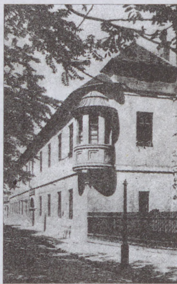
Az iskolaépület részlete 1945 előtt