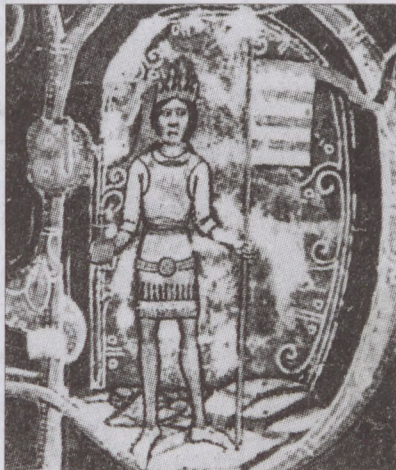
III. Béla a Képes Krónikában

Felesége, akivel egy sírban nyugszik, Chaïllon Agnes hercegnő. Ő is Bizáncban nevelkedett, és az ottani szokások szerint új nevet