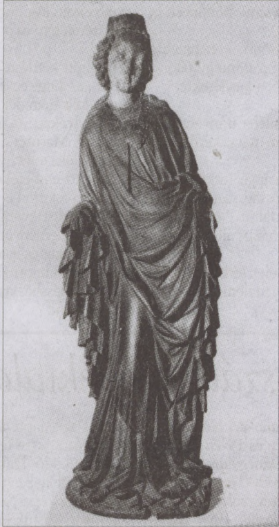
Szent Katalin szobra Barkáról