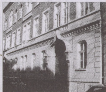
és a Krisztinavárosi Általános Iskola