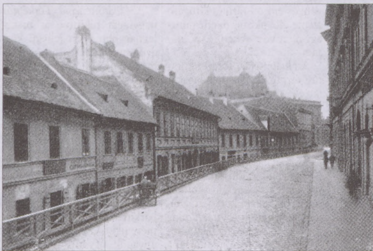
A Döbrentei utca a Döbrentei tér felől