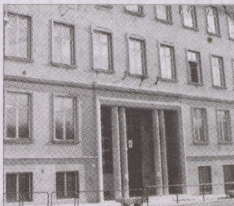
A Kosztolányi Dezső Általános Iskola és Gimnázium

Bár a városatyák közül - pártbeli hovatartozástól függően - nem mindenki találta egyformán rossznak a főváros által kirótt forrásmegosztást, a Budavári Önkormányzat Képviselő-testülete (23 szavazatból 17 igen, 2 tartózkodás és 4 nem szavazattal) úgy határozott, hogy a 2000. évi forrásmegosztásról szóló rendelet-tervezetet nem támogatja. Kivételesen érdemes szó szerint idézni az indoklásból: "A rendelet-tervezet elfogadása esetén a Budavári Önkormányzat 2000. évi költségvetése növekvő mértékben forráshiányos lesz, hiányozni fognak a források a kötelező béremelésekre, nincs ellensúlyozva az inflációs hatás, az alapfel-