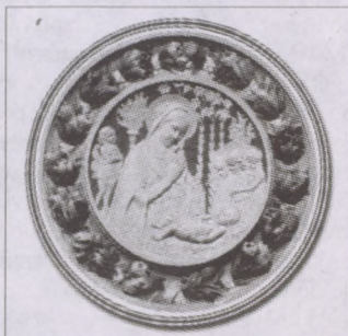
Zsolnay majolika tondo