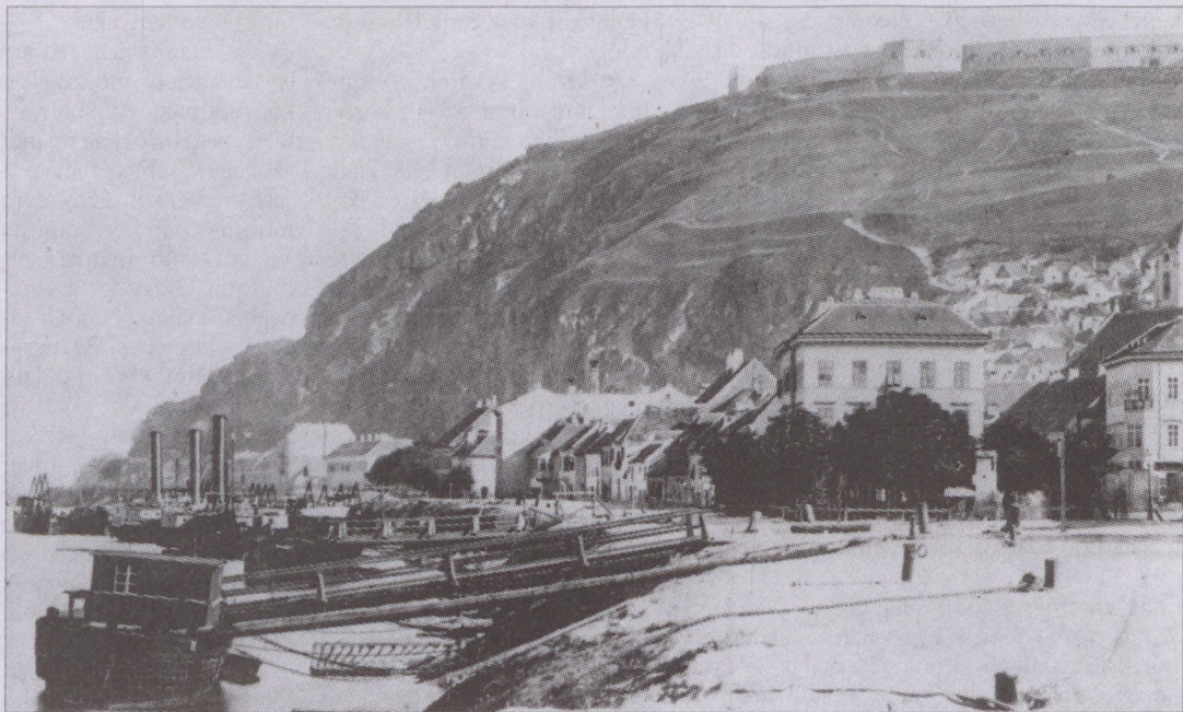
Tabán 1880 körül