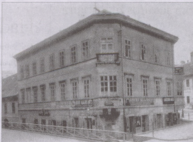
Az Apród és a Döbrentei utca sarka