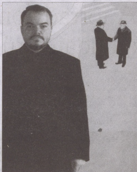
Fehér László festőművész március 15-én vette át a Kossuth-díjat

Fehér László egyébként szerény, polgári miliőben él családjával egy budapesti bérházban. A művész hajlamosak vagyunk romantikus bohémnek elképzelnéni - holott neki még mobiltelefonja sincs: „A maroktelefon nem az én világom” - mondja. „Számomra Magyarország az a terep, ahol a világpolgárságot meg kell teremtenem.”