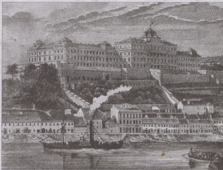
A királyi palota (Fametszet 1866-ból)