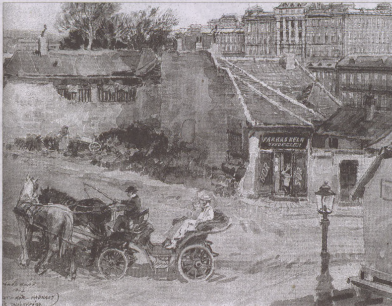
A városrész felszámolása előtt a művész 100-120 vázlatot készített

utcákat, utcárszleteket, házakat, jellegzetes városrészeket. Az anyagot akkor nem tudta feldolgozni, mert behívták katonának a lovastüzerékhöz, ahol másfél évet szolgált. 1938 volt a művész életének legboldogabb éve: a Felvidék visszacsatolása, aztán megint bevonulás, megint leszerelés. Jött az erdélyi, délvidéki hadjárat és már folyt a második világháború. A Don-kanyart ugyan megúszták, de 1944-ben a Szovjetunióban találta magát. A háború után nem lehetett képet eladni, a tabáni vázlatok fiókok mélyén pihentek hosszú évekig.