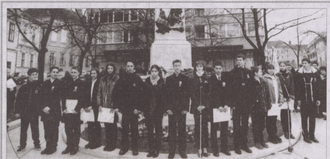
A kerület fiataljai is megemlékeztek a forradalomról. Képünkön a Budavári Általános Iskola diákjai ünnepelnek a Dísz téren

vallási szokásokhoz, pogány hagyományokhoz és a római történelemhez egyaránt. Épp ezért - mutatott rá Jankovits Marcell - a Pilvax ifjúsága nem véletlenül döntött úgy, hogy már március 15-én kibontja a forradalom zászlaját. S noha az 1848-as forradalom nem Magyarországról indult, mi vagyunk az egyetlenek Európában, akik megünnepeljük.