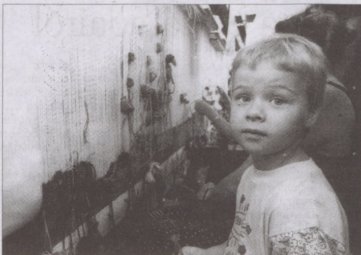
A műhely hetente kétszer a közönség számára is látogatható

- A Millenniumi Kormánybiztosi Hivatal támogatásának köszönhetően harminckét művész által közösen tervezett és szőtt alkotást az esztergomi Keresztény Múzeumban helyezik majd el. Címe: Szent István és műve. Folytak egy nemzetközi ünnepi kiállítás előkészületei is a Szépművészeti Múzeumban, Kárpit címmel. Ezen kívül tervbe vették egy, az ezredfordulóra tervezett