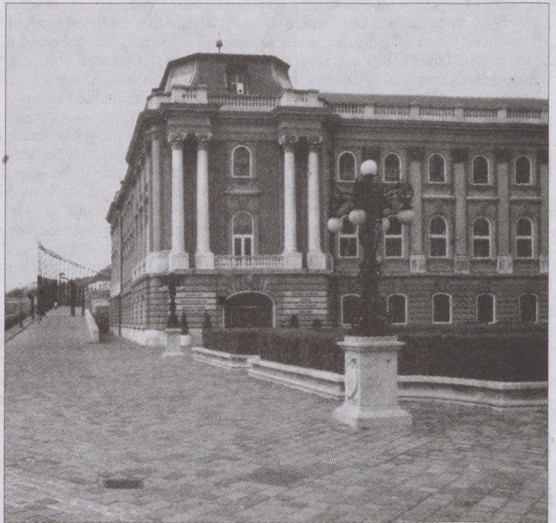
A budai Vár IV. Béla uralkodása óta az ország egyik legfontosabb hadászati erőssége