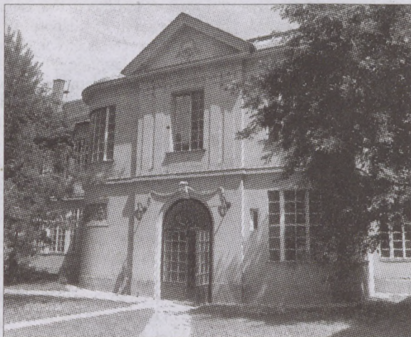
Az Áldásy palotában nincs raktározási gondja az Intézetnek

mény. Az intézet másik részéhez tartozik a dokumentáció, amely az előadásokhoz kapcsolódó sajtóanyagokat gyűjti és dolgozza fel. Az adatbank a színházi előadások adatbázisa, mely folyamatosan bővül, az új bemutatók paramétereivel visszamenőleg is. Jelenleg a hetvenes éveknél tartunk. Ennek alapján évente közzé tesszük az előző évad adatait. Ez rendkívül hasznos a szakma számára, hiszen sok mindent a színház maga sem tart ilyen praktikus módon nyilván. Külön részlegünk a könyvtár, szakkönyvekkel, szöveggönyvekkel, külföldi és hazai folyóiratokkal il-