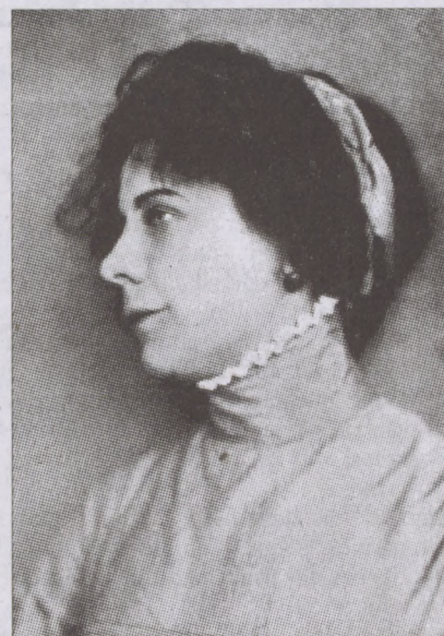
Kaffka Margit mesterien ábrázolta a dzsentri réteg pusztulását és a női sors változását a századfordulón