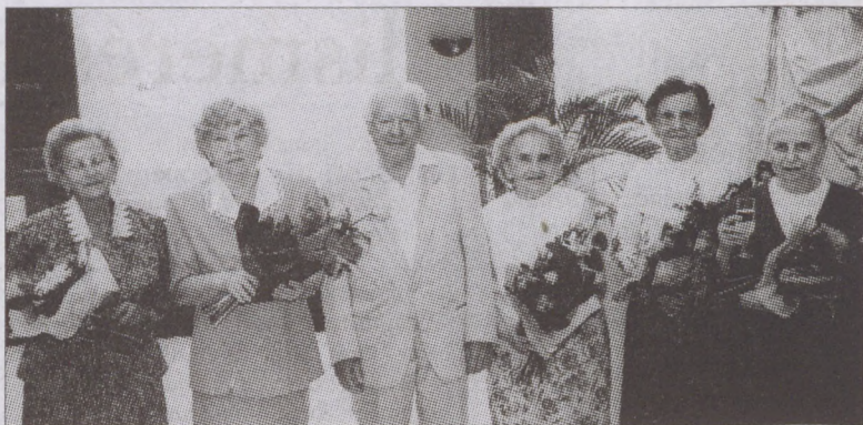
Több évtizedes pedagógusi munkájukért hatan vehették át az arany-, a gyémánt- illetve a vasoklevelet

okítja a gyerekeket matematikából és fizikából. Mióta az esztét tudja, mindig tanár akart lenni. Édesanyja is tanár. S az évek múltán tanár dinasztíába került. Férje, akit az ELTE-n ismert meg, szintén tanár, de anyósa, apósa, sógornője is a katedra mellett döntött. S hogy miért épp a matematika és a fizika vonzotta? Mindig előbb volt kész a feladatmegoldásokkal, mint a fiúk, s