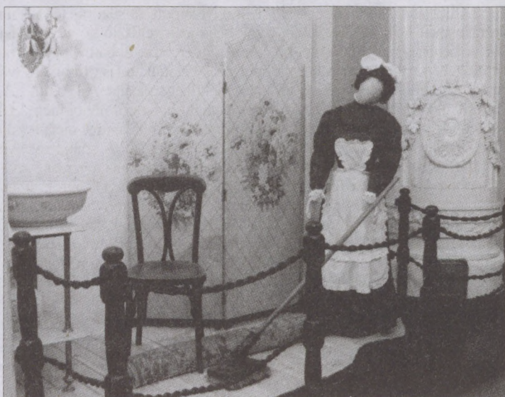
Részlet a Vendéglátó Budapest című kiállításból

kából a bérleti díjat és a fizetéseket kell fedeznünk. A szűkös anyagiak és a helyhiány miatt tudományos munkára, gyűjteménygyarapításra alig van módunk. Két állandó kiállításunk van, bár az anyagainkból lehetőségünk lenne csodálatos időszakos kiállításokat rendezni. Nincs előadótermünk, s ha szükséges, a