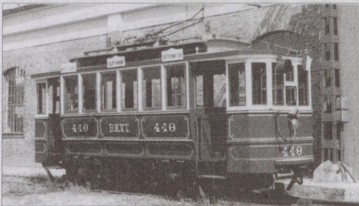
A Lánchíd budai hídfőjétől öt lóvasút-vonal indult

még századunkban is sokáig sötétbarna volt, a mai sárgához hasonló színű díszítéssel. Ez azért alakult így, mert a Budapesten egymással is versengő öt-hat (olykor több) közlekedési társaság közül a nálunk lábát megvető BKVT (Budai Közúti Vaspálya Társaság) könnyű favázás szerkezetű, zárt peronú kocsijai ilyen színűek voltak. A motorkocsikat egy vagy két 20 lóerős vontatómotorral látták el, így azok 43 vagy 49 személyesek voltak 17-23 ülő, illetve 25-26 állóhellyel. Több típusú pótkocsi is közlekedett így a „K”, az „L” vagy az „I”. A „K” 30, az „L” 46 személyes volt, az új „I” típusú viszont 50. Ez utóbbi utasterében 16