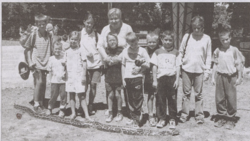
Változatlanul gazdag programot kínál a Czákó utcai Sport- és Szabadidőközpont a kerületi fiataloknak. Legutóbb egy 5 méteres pítont örvendeztetett meg az ifjúságot. Egész nap simogathatták a hullót...