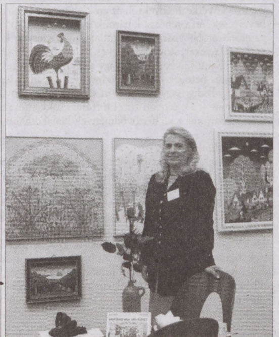
A Galériába a valamikori paraszti világba pillanthatunk