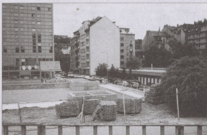
A főváros kerületei közül a miénk alkotott először teljes körű építési szabályzatot

A szakember szerint a helyi építési szabályzat az a demokratikus úton létrejött jogi eszköz, amely nem sommásan, hanem individuálisan is szabályozza a térség jelenét és jövőjét, amelynek mozgásterét jószerével csak az állami jogszabály korlátozza. S hogy ez mit jelent? Többek között azt, hogy a helyi építési szabályzat különbséget tud tenni a más-más városrészektől. Krisztinaváros és Naphegy, vagy a Tabán és a Vérmező között, figyelembe veszi a kerületi sajátosságokat. Azt például, hogy a környezetbe illő legyen a tető, az építőanyag. S nem hagyja figyelmen