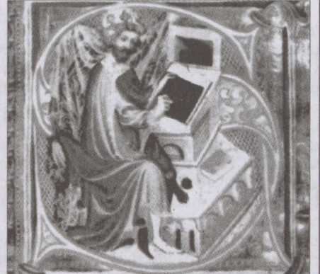
A Corvina Könyvtár állománya sok esetben túlszárnyalta a jelentős itáliai fejedelmi könyvtárakat

Hogy pontosan mikor alapította Mátyás a könyvtárát, arról nincs adatunk. Azt viszont tudjuk, hogy legfőképpen Vitéz János és Janus Pannonius voltak rá hatással a könyvek megbecsülésében és szeretetében. Korának itáliai fejedelmi könyvtárai is példaként lebegtek előtte. Janus Pannonius mint tudós humanista könyvtároskodott is Mátyás bibliotékájában. Az olasz származású író és