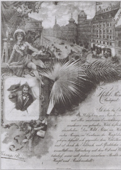
A Rémi Szállodában mindenki jól érezte magát...

fővárossá válásának képeskönyve a kor híres vendéglátó helyeinek tárgyi és írásos emlékeivel. Ebben az időszakban alakultak át a fogadók korszerű szállodákká. A polgárosodó nagyvárosban, a cukrászdák, a kávéházak, a vendéglők, a mulatók jellegzetes világában kalandozhat az érdeklődő. A Kugler-Gerbeaud, a Wampetics, a Gundel emlékei, a Palace Szálló bárjának berendezése, a művész-kávéházak enteriőre elevenedik meg. A látogatók megismerkedhetnek a századfordulón használt néhány különleges éttermi tálaló és evőeszközzel - ki látott már pecsenyelé osztót, spárga fogót és húspuhítót, az előragót? A kiállítás felidézti továbbá gyógyfürdőink létrejöttét, az 1918-ban nyílt Szent Gellért-fürdő úgynevezett