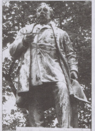
Ybl Miklós szobra

A XIX. század második felének nagy - sokak szerint a legnagyobb - építész volt. Művei mindenütt megtalálhatók az országban a legkisebb településtől kezdve a nagyobb városokig és természetesen Budapest sok pontján is. Számunkra természetesen főként a Várban és közvetlen környékén végzett munkái az érdekesek.