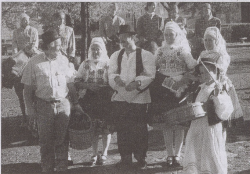
A nagytarcsai viseletű asszonyok, a huszárok, és a menet szervezői