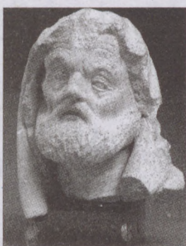
Apostol- vagy prófétafej (1420 körül)