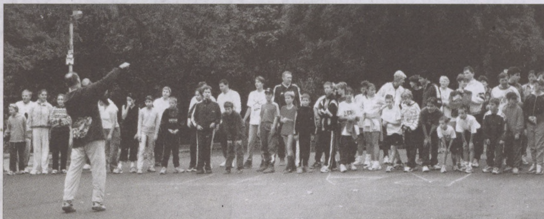
Rajtra készen a futóverseny résztvevői

Szomorú idő, vidám nap, izgalmas versenyek