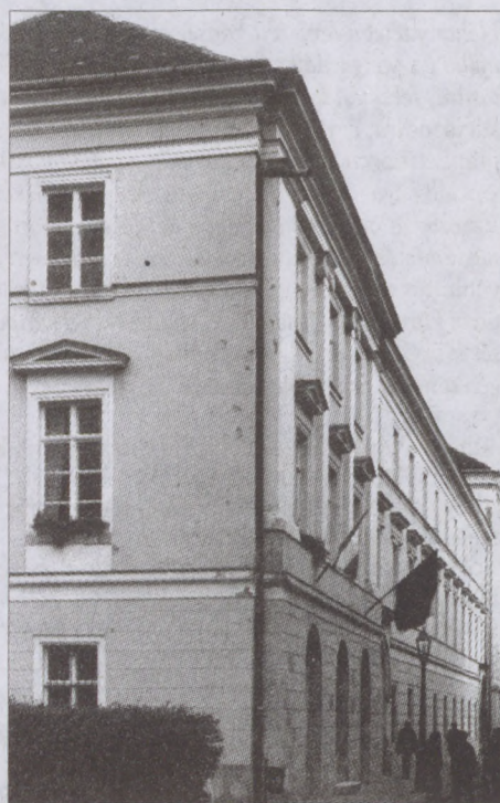
Az akadémiai intézetek épülete

a török kort kutatja, azt, hogy miképp működött akkoriban az ország. Szintén készül e korszak tisztviselői tára, Magyarország - elsősorban katonai - tisztviselőiről, és egy nagy összefoglalás a török végvárrendszerben szolgáló török katonaságról. Komoly feladat a nemrég megnyílt Római Hittani Kongregáció levéltárának feltárása, melyhez néhány éve kezdtek hozzá kutatóink. Óriási mennyiségű az itt található magyar vonatkozású anyag. Az újkori osztály munkájának súlypontja a dualizmus korszaka. A kutatás érdekessége, hogy nem a bécsi kollégák, ha-