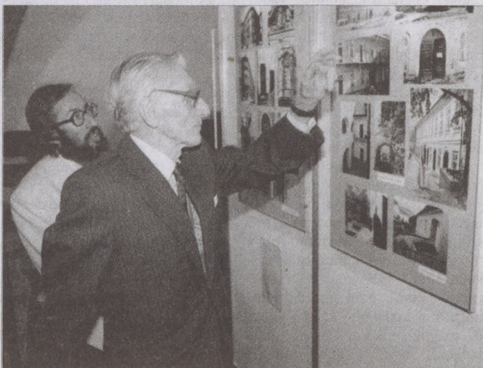
A régmúlt utcái, terei keltek életre a Tabánt bemutató fotókiállításon

Végigtanulmányozva a felvételeket, megtudhattuk, hogy mindössze 38 épület maradt ebből a vá-