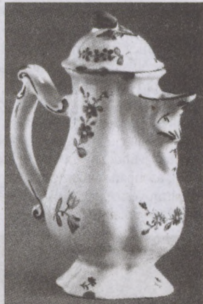
Fedeles kanna, Tata

Buda első gyáralapítója volt, nagy szakmai tudású, talpig becsültes polgár. Szorgalma folytán felemelkedett, megbecsülést, vagyont szerzett. A sors különös fintora, hogy élete utolsó éveiben mégis elfeledett, megkeseredett ember vált belőle. Szegénységben és elhagyatottságban halt meg.