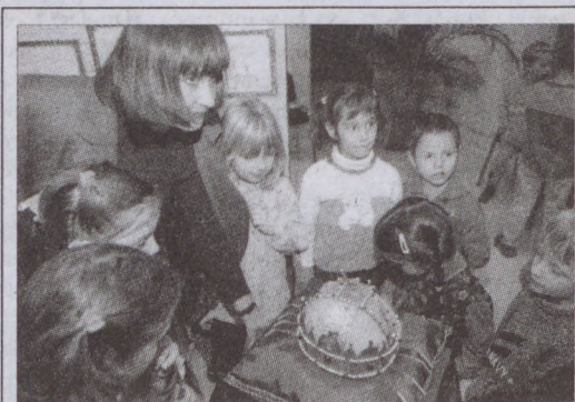
Magyarország a mi hazánk címmel október 24-én közös kiállítás nyílt a Városháza aulájában a kerület óvodásainak munkáiból. Az egyéni és csoportos alkotások elsősorban arról adnak számot, miként élték meg a gyermekek az idei, milleniumi esztendő eseményeit.